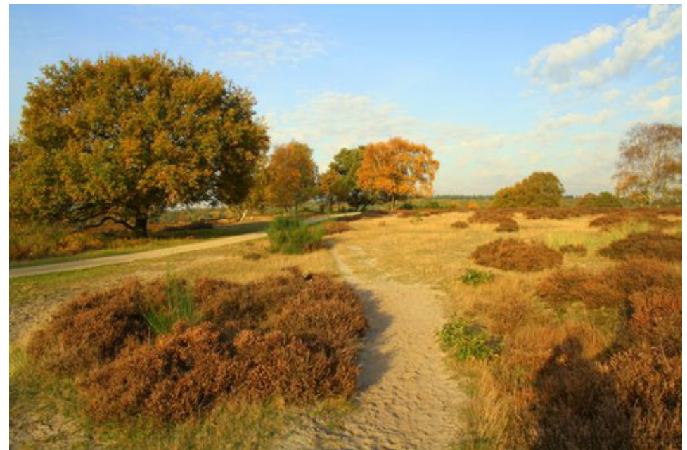
Sfeerbeeld droge heide