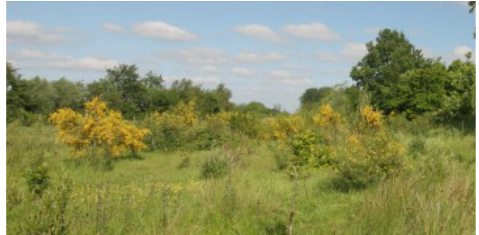
Sfeerbeeld heischraal grasland en mantel- en zoomvegetaties

Nadat alle graven zijn uitgegeven en de laatste begrafenis is geweest, eindigt de functie van natuurbegraafplaats. De eigenaar van het landgoed neemt dan het beheer en onderhoud weer over. Door NBN wordt een stichting opgericht waarbinnen gedurende de exploitatie van de natuurbegraafplaats een vermogen wordt opgebouwd ten behoeve van het natuurbeheer op landgoed Christinalust in de toekomst.