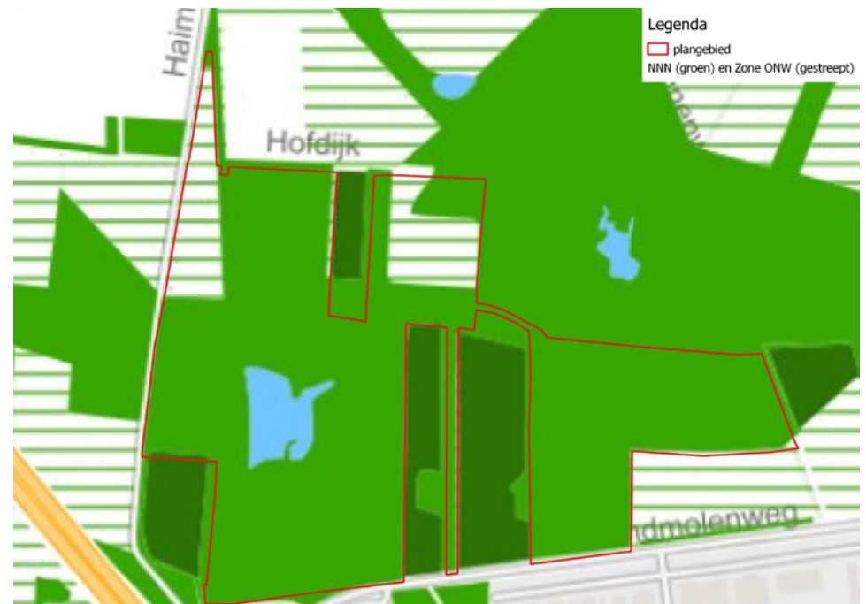
Kaart NNN met plangebied toekomstige natuurbegraafplaats. Groen gevuld is NNN, groen gestreept is Zone ONW

De natuurontwikkeling op natuurbegraafplaats Christinalust heeft een positief effect op het NNN.