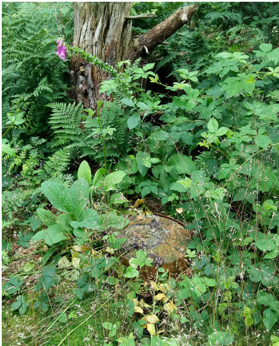
De vegetatie ontwikkelt zich op een gedicht natuurgraf snel. Op de foto is een graf op Heidepol te zien van circa 3 jaar oud. In het midden is de boomschijf, die dient als grafmarkering, nog te zien. Daarnaast nemen grassen, kruiden en struikvormers de overhand.

Op de kaart 'Effecten op het NNN' (pagina 8) is een overzicht te zien van de te nemen maatregelen ten behoeve van de ontwikkeling van de natuurbegraafplaats met positieve en negatieve effecten op de kwaliteit en kwantiteit van het NNN. Geconcludeerd kan worden dat door de realisatie van de natuurbegraafplaats en de natuurontwikkeling die daarmee gepaard gaat, ervoor gezorgd wordt dat het NNN in kwalitatieve zin verbeterd wordt. In kwantitatieve zin gaat het NNN er door de bouw van de ceremonieruimte en de aanleg van de parkeerplaatsen op achteruit. Het ophogen van het terrein zorgt voor een tijdelijke achteruitgang van de waarden van het NNN. Deze verliezen worden gecompenseerd.