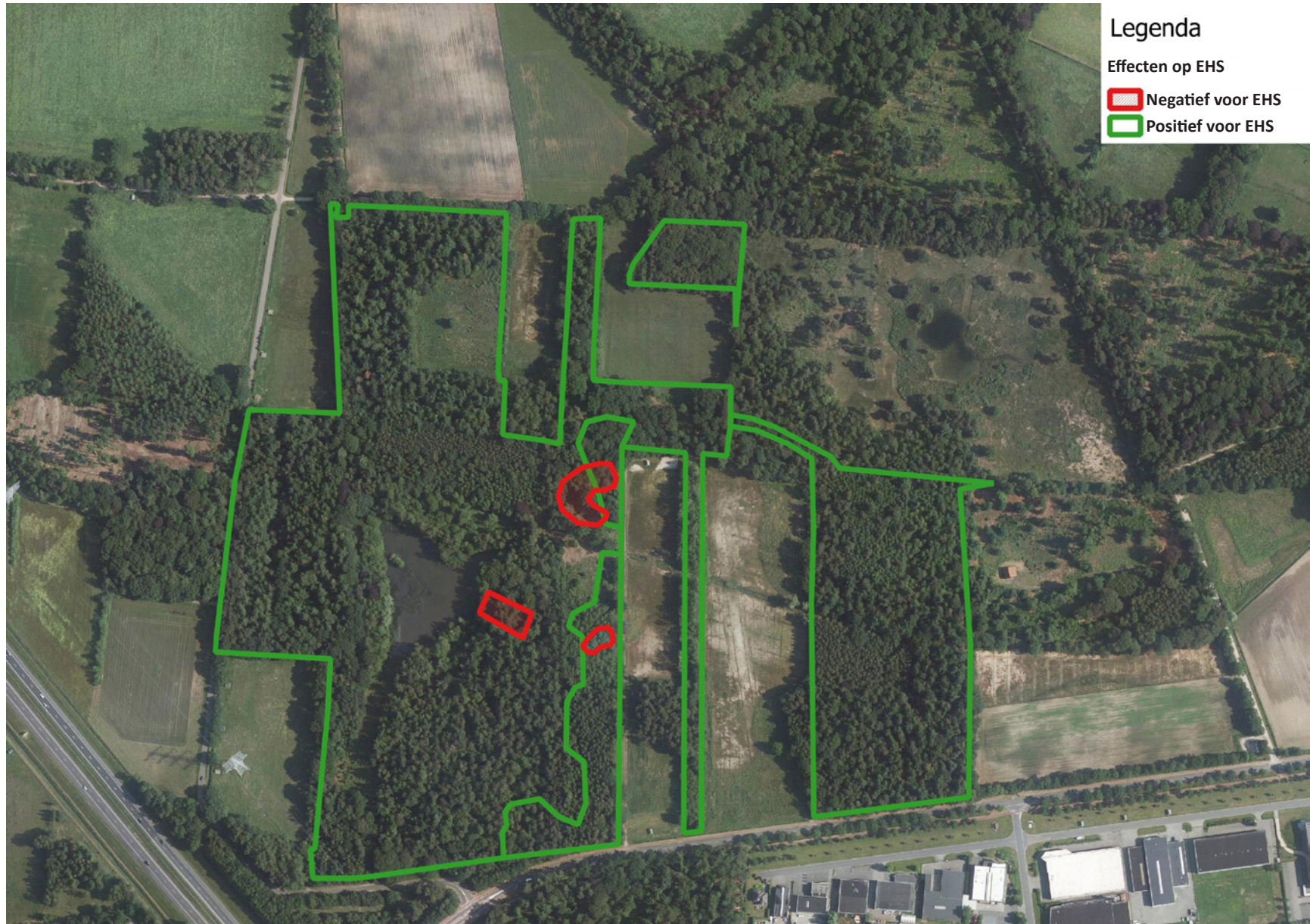
Effecten op het NNN