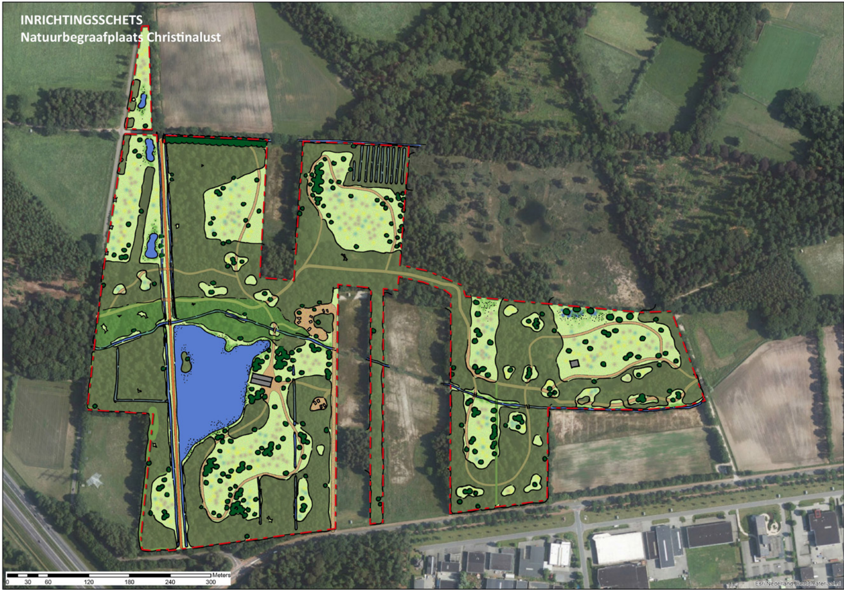
Inrichtingsschets van de toekomstige natuurbegraafplaats