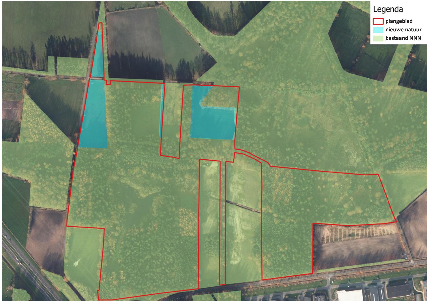
Nieuwe natuur op natuurbegraafplaats Landgoed Christinalust