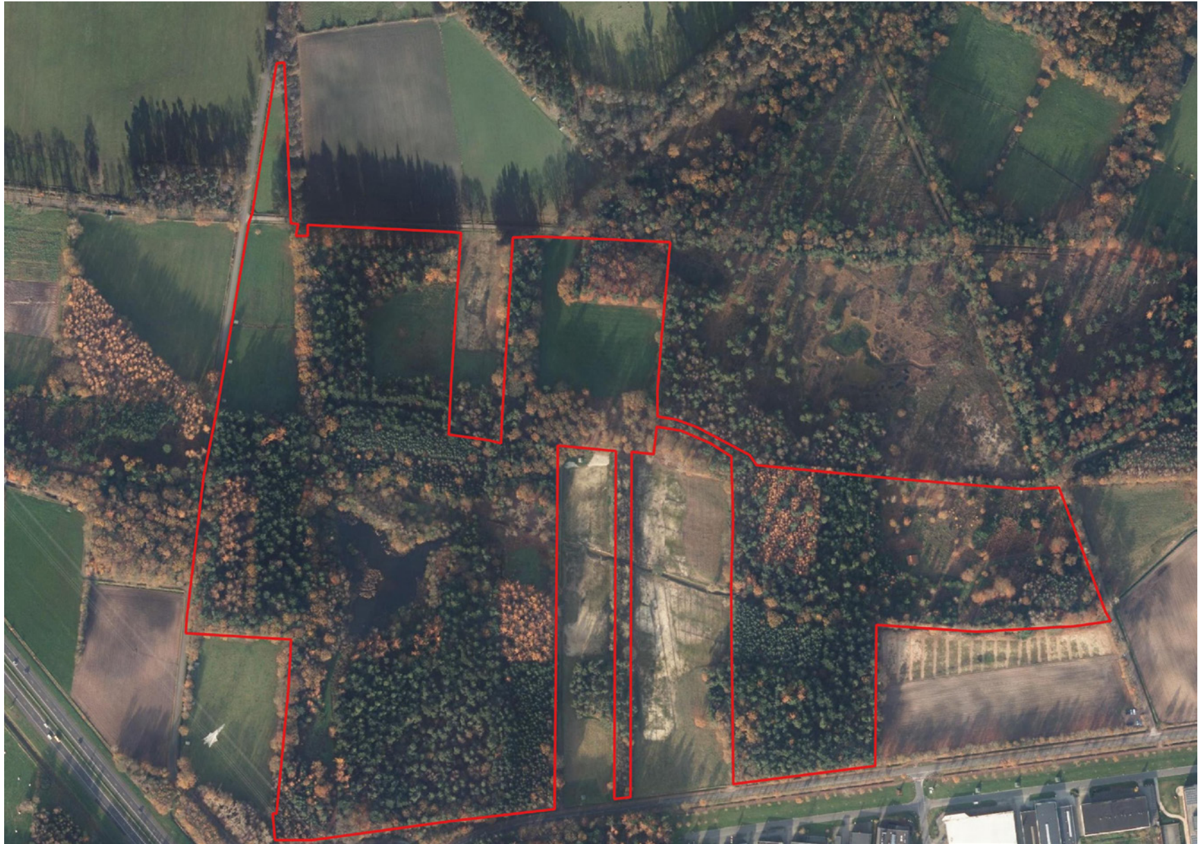
Luchtfoto van de toekomstige natuurbegraafplaats