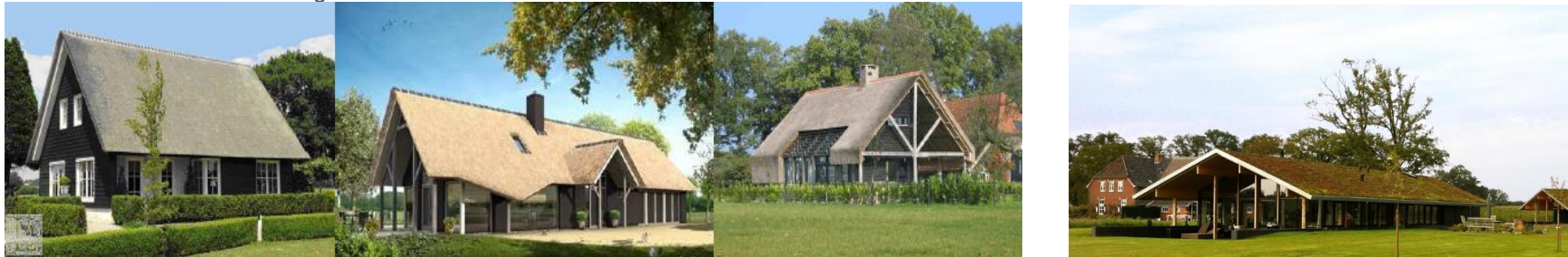
Referentiebeelden bebouwing 'hoofdvolume'