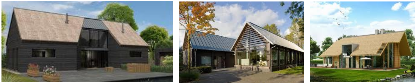
Referentiebeelden bebouwing 'schuurwoningen'