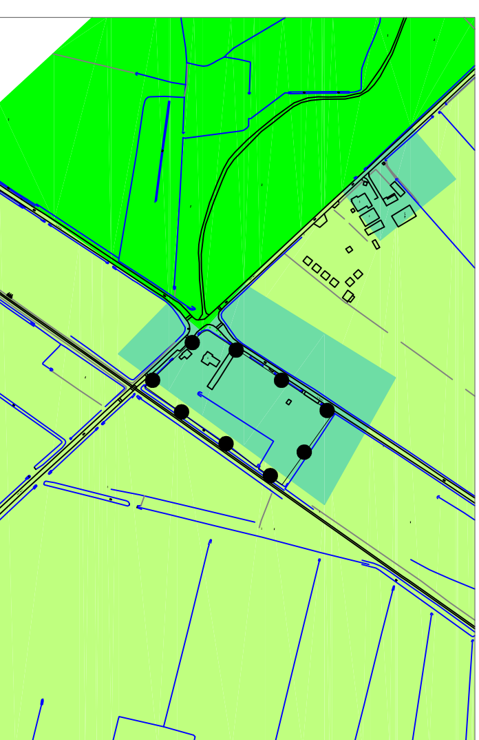
fragment vastgestelde WELSTANDSNOTA januari 2014