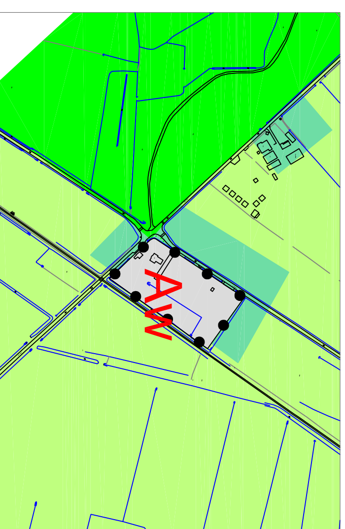
wijziging 74 WELSTANDSNOTA