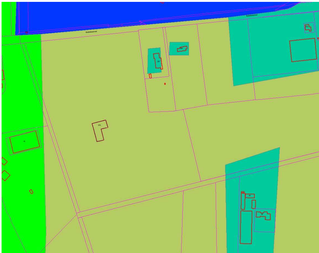
Uitsnede kaart Welstandscategorieën

Het plangebied ligt in de welstandscategorie “Vrije landelijke bebouwing”. Deze welstandsidentiteit bestaat uit gebouwen die ruimtelijk een bescheiden rol spelen. De gebouwen staan min of meer 'toevallig' verspreid in het landschap, in het bos, tussen de open weiden, aan een boerenerf, langs een weg of op een kruispunt, eenzaam en alleen of in een kleine buurt bij elkaar. Vrije landelijke bebouwing heeft een belangrijk aandeel in de levendigheid van het landelijk gebied. De welstandszorg wil beperkt ruimte geven aan nieuwe, vrije landelijke woningen, met behoud van de kwaliteit van het landelijk gebied. Bijzondere gebouwen, zoals de MFA, mogen vanwege hun (landelijke) functie of eigen kwaliteit afwijken van de landelijke woningen (bijvoorbeeld qua grootte). Wel moeten ze zoveel mogelijk kenmerken van de identiteit dragen, zodat ze bijdragen aan de eenheid binnen de categorie.