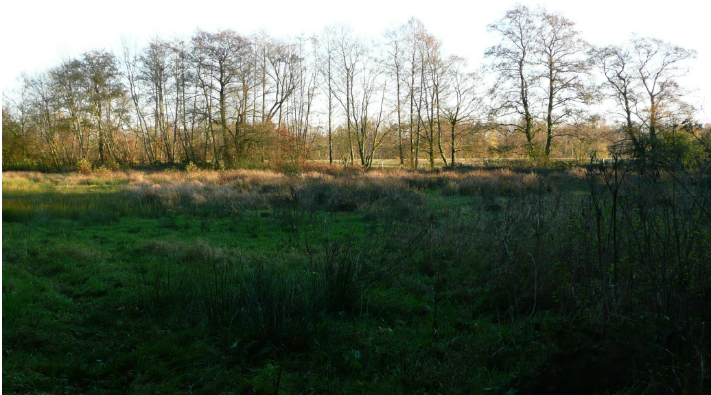
Afbeelding 2. Het Aamsveen.

Het provinciaal beleid, dat middels de verordening is geëffectueerd, stuurt aan op de afname van stikstofdepositie in Natura 2000 – gebieden. De planologische situatie doet daar verder niets aan af.