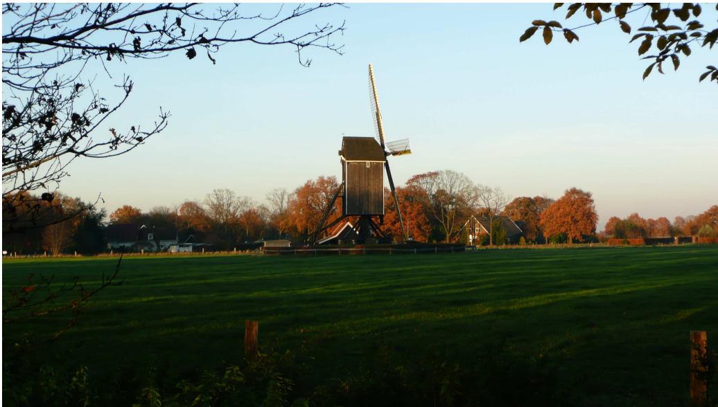
Afbeelding 1. Het buitengebied ter hoogte van de Wissinks Møl, Usselo.

Voor het gedeelte, gelegen ten zuiden en ten oosten van de bebouwde kom van Enschede, is een nieuw bestemmingsplan opgesteld. Het plangebied van het bestemmingsplan wordt globaal begrensd door de Haaksbergerstraat, de bebouwde kom, de Lossersestraat, de grens met de gemeente Losser, de rijksgrens met Duitsland (Nordrhein-Westfalen) en de grens met de gemeente Haaksbergen. Dit bestemmingsplan, ‘Buitengebied Zuidoost’ heeft ter visie gelegen van 21 juni 2012 tot en met 1 augustus 2012. Tijdens de periode van ter inzage legging zijn er drie informatiebijeenkomsten georganiseerd (één bijeenkomst in het centrum van Enschede, één bijeenkomst in Stadsdeel Oost en één bijeenkomst in Stadsdeel Zuid).