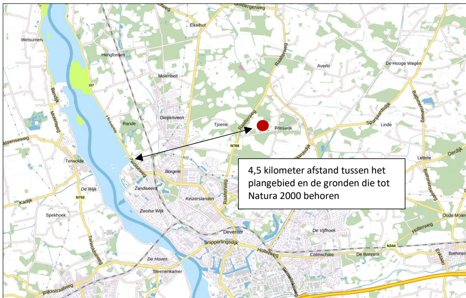
Ligging van Natura 2000-gebied in de omgeving van het plangebied. De ligging van het plangebied wordt met de rode stip aangeduid. Gronden die tot Natura 2000 behoren worden met de blauwe en lichtgroene kleur aangeduid.

Het plangebied ligt op minimaal 4,5 kilometer afstand van Natura 2000-gebied. Het meest nabij gelegen Natura 2000-gebied, is Rijntakken. Op onderstaande afbeelding wordt de ligging van het Natura 2000-gebied in de omgeving van het plangebied weergegeven.