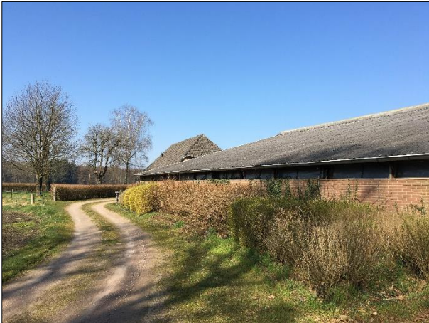
Mogelijke rust- en/of voortplantingslocatie van grondgebonden zoogdieren onder dichte begroeiing.

voortplantingsplaats in te bezetten. Een geschikte plek voor steenmarter om een vaste rust- of voortplantingsplaats te bezetten, ontbreekt in het plangebied.