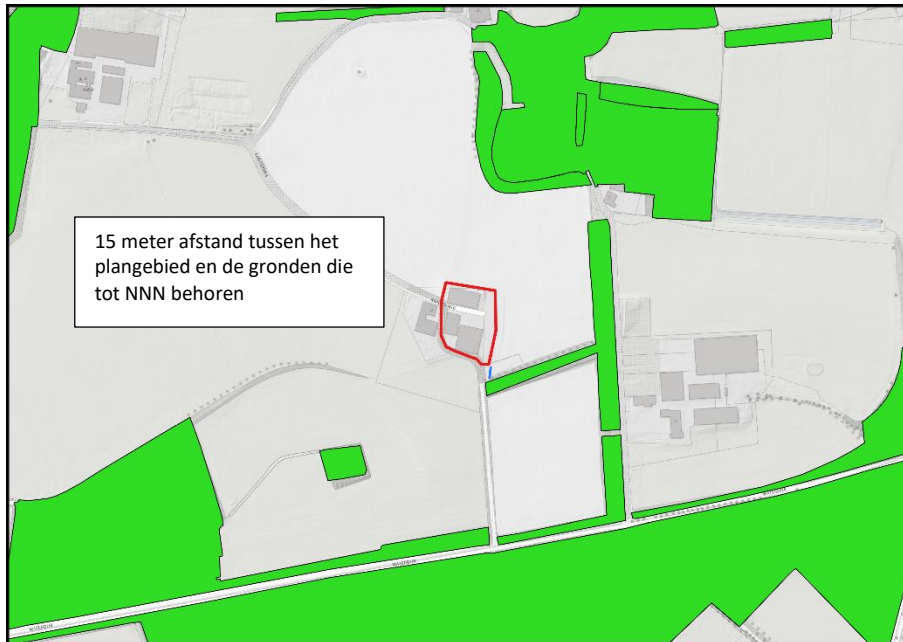
Ligging van Natuurnetwerk Nederland in de omgeving van het plangebied. De ligging van het plangebied wordt met de rode lijnen aangeduid. Gronden die tot Natuurnetwerk Nederland behoren worden met de groene kleur op de kaart aangeduid.