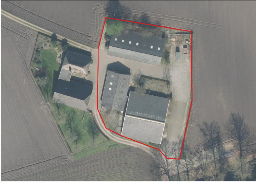
Begrenzing van het plangebied wordt met de rode aangeduid.