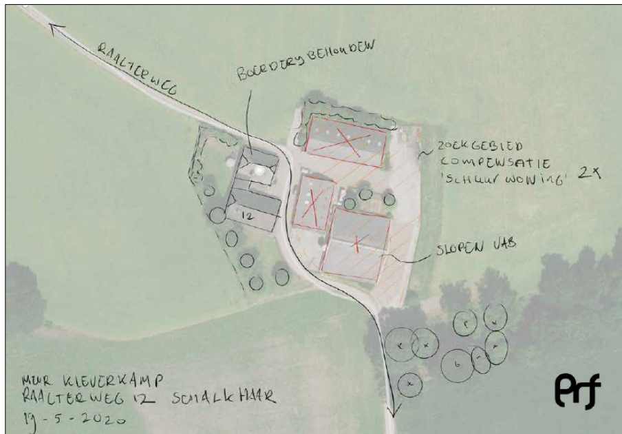
Plattegrond van het wenselijke eindbeeld.

Het voornemen bestaat om twee woningen met bijgebouwen te realiseren. Om dit mogelijk te maken worden de werktuigenberging, ligboxstal en jongveestal gesloopt, erfverharding verwijderd en wordt omliggende beplanting gerooid. Overige beplanting en de bestaande woonboerderij blijven behouden en worden niet negatief beïnvloed bij uitvoering van de voorgenomen activiteiten. Op onderstaande afbeelding wordt een plattegrond van het wenselijke eindbeeld weergegeven.