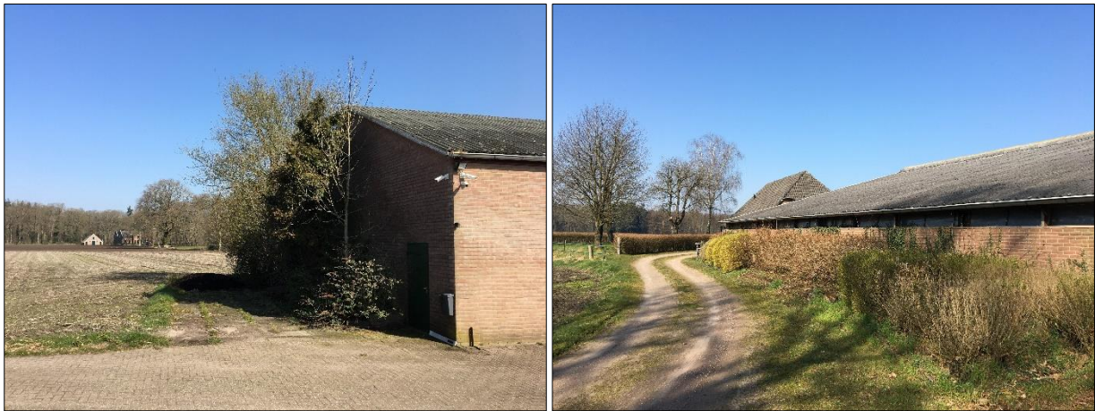
Potentiële nestplaats voor vogels in de opgaande beplanting;.

Het plangebied behoort tot functioneel leefgebied van verschillende vogelsoorten. Vogels benutten het plangebied als foerageergebied en vermoedelijk nestelen er jaarlijks vogels in het plangebied. Vogels kunnen een nestlocatie bezetten in de te rooien beplanting en in de te slopen schuren. Vogelsoorten die mogelijk in het plangebied nestelen zijn houtduif, holenduif, witte kwikstaart, merel, zanglijster, winterkoning, vink en roodborst. Er zijn tijdens het veldbezoek geen huismussen waargenomen en de te slopen bebouwing wordt niet als een geschikte nestlocatie voor deze soort beschouwd. Tevens zijn er geen aanwijzingen aangetroffen dat boerenzwaluw en huiszwaluw een nestlocatie in het plangebied bezetten. Er zijn geen nestsporen van deze soorten waargenomen aan de gevels, in nissen, onder balken of op andere geschikte nestlocaties. Het plangebied ligt binnen het verspreidingsgebied van de steenuil maar er zijn geen aanwijzingen aangetroffen dat deze soort het plangebied benut als foerageergebied (NDFP). Er zijn geen oude of potentiële nesten van roofvogels of uilen in of rondom het plangebied waargenomen. Deze nesten zijn doorgaans gemakkelijk te vinden aan de hand van schijfsporen en braakballen.