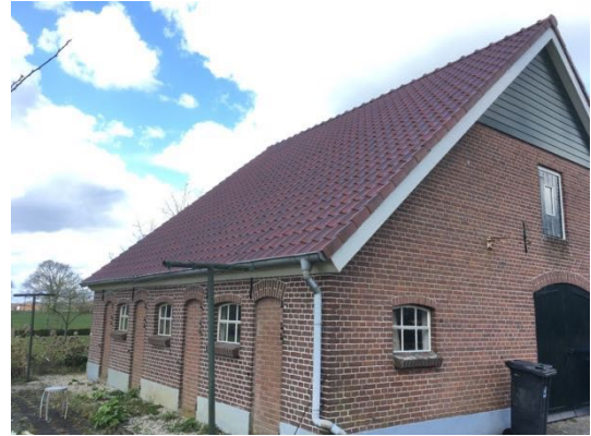
Figuur 2 & 3. Voorzijde schuur (l) en zijkant.