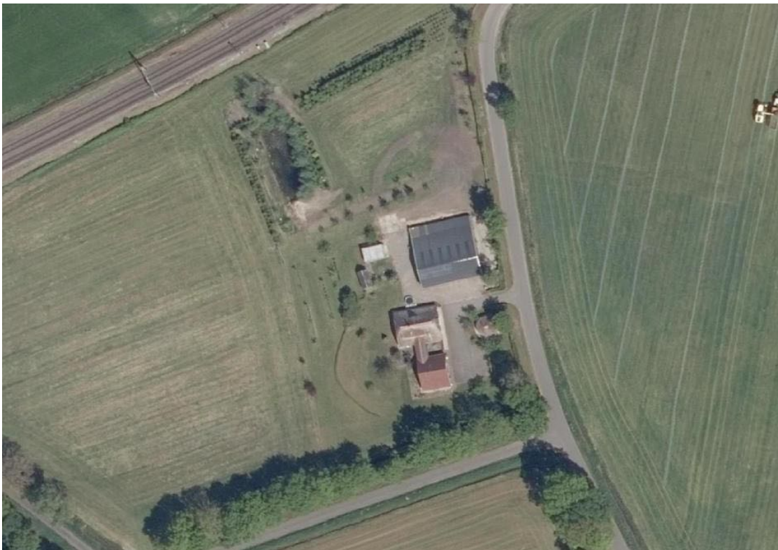
Figuur 1. Recente luchtfoto van het erf en de directe omgeving.

Het plangebied wordt gevormd door een schuur die aan de woning geschakeld is via een korte gang. Het gebouw stamt uit 1925 en beschikt over gemetselde gevels en een zadeldak gedekt met keramische pannen. De gevels zijn enkelwandig, het dak is van binnenuit geïsoleerd.