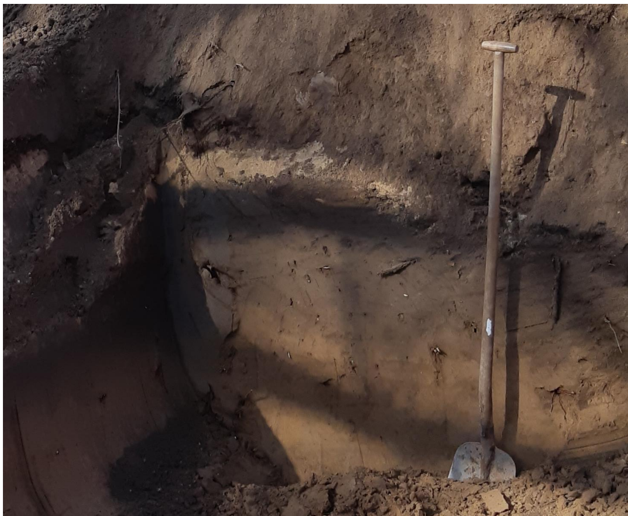
Afb. 3.1: Het profiel aan de noordwestzijde van de ontgraving, ter hoogte van het verwachte dijklichaam. Onderin de licht gekleurde kronkelwaardafzettingen, bovenin een egaalbruine akkerlaag.

Centraal in het ontgraven gebied bevond zich één vierkante kuil, die voornamelijk was volgestort met puin en afval. Onderin bevond zich echter een ook een concentratie van kleinkaliber 7,92 mm hulzen (100+). Een deel van deze hulzen vertoonde in de corrosie resten van een grof geweven textiel (jute?), die suggereren dat deze hulzen mogelijk in een zak of doek verpakt in de kuil zijn geworpen. Een exemplaar is verzameld om de bodemmerken nader te determineren. Het gaat om munitie van Duits fabricaat, afkomstig uit de Rheinisch-Westfälische Sprengstoff A.-G., Werk (Nürnberg-Stadeln), geproduceerd in 1940. 2 Alle hulzen waren verschoten en voorzover kon worden vastgesteld identiek. Het is niet zeker of deze hulzen hier tijdens de Tweede Wereldoorlog al zijn gedumpt, het kon niet worden uitgesloten dat het hier een kuil van jongere datum betreft.