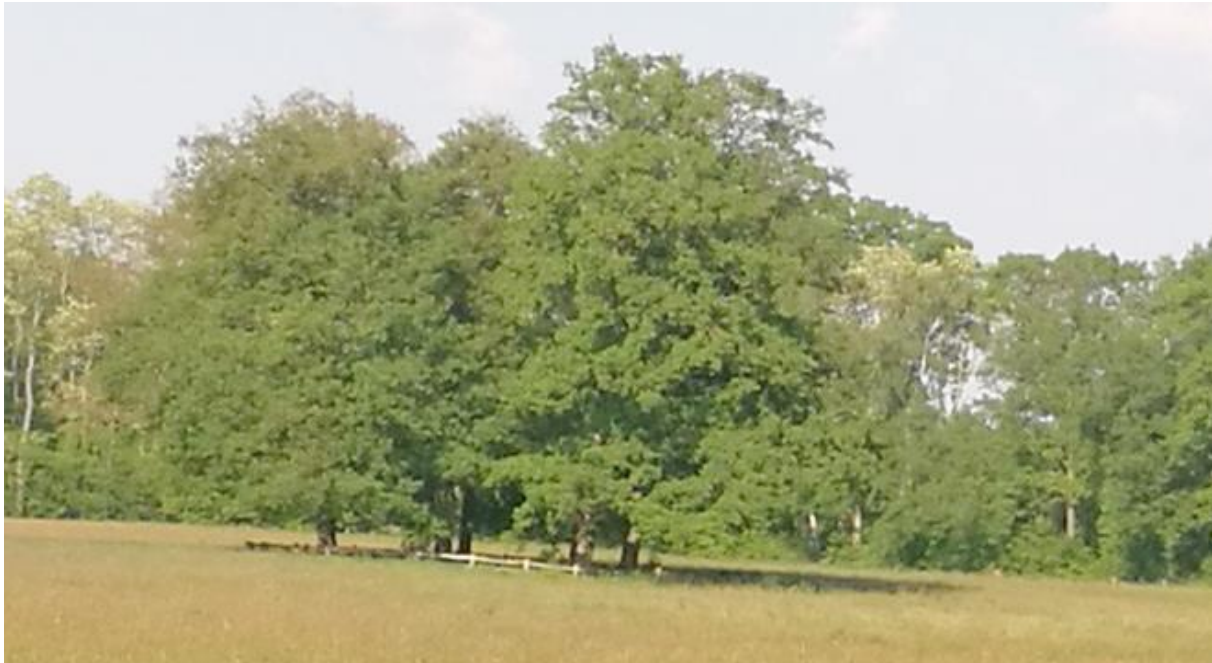
Figuur 2 Boomgroep van eiken met een acacia hekwerk eromheen als voorbeeld van een te plaatsen boomgroep. Landgoed Overvelde aan de Boxbergerweg.

De weide aan de westkant moet open blijven zodat de landwinkel en het restaurant goed zichtbaar zijn vanaf de Spanjaardsdijk. Er staat langs de weg al een meidoornhaag wat goed aansluit bij de meidoornhagen om het bouwblok. Heel gebruikelijk in Salland worden in de weide boomclusters geplaatst die voor schaduw zorgen voor het vee. Deze krijgen een acaciahouten afscheiding, zodat het vee de stammen niet aanvreet. Deze opgekroonde bomen zijn meestal eiken. Het landgoed Overvelde heeft er veel van staan. Deze boomgroepen hebben ook de functie om de wind te breken.