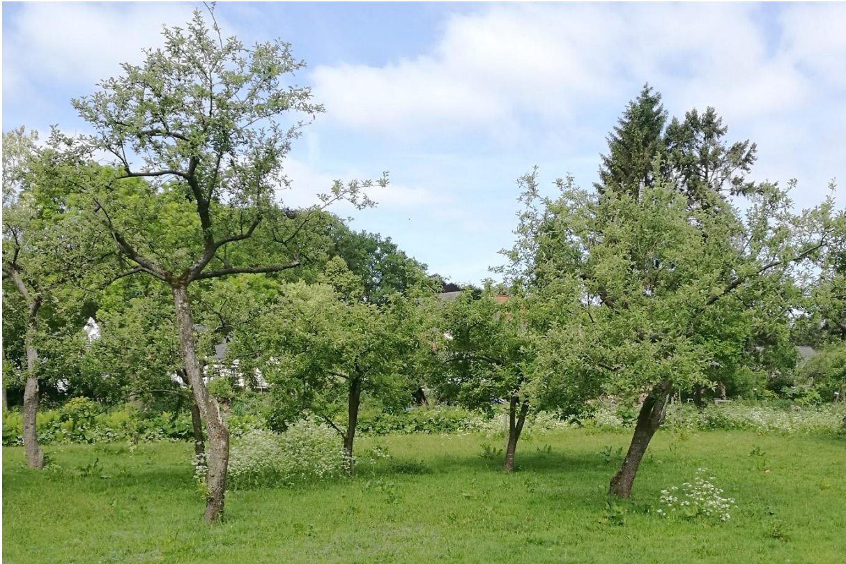
Figuur 3 Oude boomgaard hoogstam als referentiebeeld.

Campers kunnen op het aan te leggen scheidingszandpad van camping en de permacultuurtuin staan. Hier worden ook de stopcontacten en waterpunten aangelegd. De looproute van de camping naar de stal waar de was- en douche- gelegenheid is, is zo ook het kortste. Op deze manier hebben noch de bewoners, noch de ondernemers op De Oorsprong last van de kampeerders.