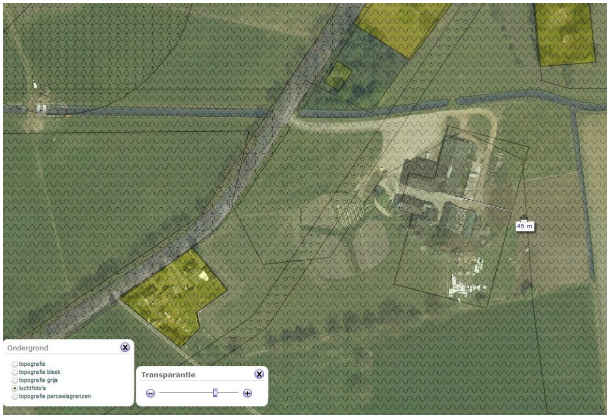
Figuur 1 Bouwblok van De Oorsprong. De bedrijfswoning betreft het gebouw dat is verbonden met het restaurant. De winkel en stal bevinden zich als één geheel aan de noordkant.

De opgave voor de landschapsarchitect is om het centrum in te passen in de landelijke omgeving en te voorkomen dat omwonenden last hebben van de bedrijfsactiviteiten. Het grondplan en het karakter van de oorspronkelijke boerderij moeten zoveel mogelijk intact blijven.