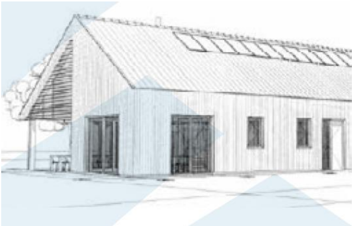
Figuur 5 Indruk van een schuurwoning.

Wat betreft de vormgeving van de bedrijfswoning zal er sprake moeten zijn van het realiseren van een schuurwoning. Te zijner tijd zal een bouwvergunning worden aangevraagd die door de gemeente op basis van welstandseisen zal worden beoordeeld. Als illustratie geeft figuur 7 een indruk van de vormgeving (uit: Kansen uit buiten, gemeente Deventer).