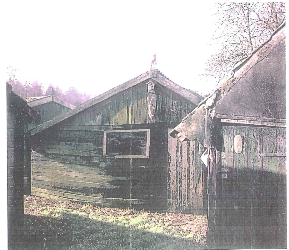
Foto's af te breken stallen