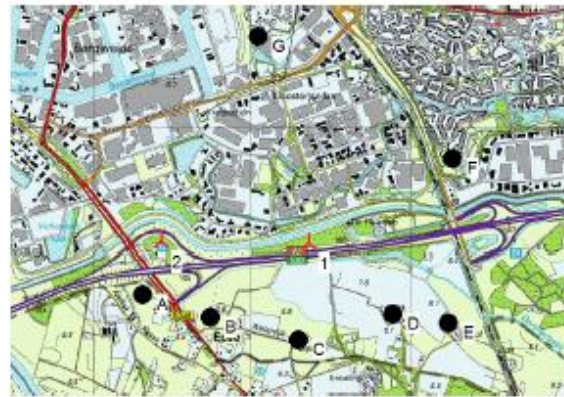
▲ New WTG ● Shadow receptor

Operational time N NNE ENE E ESE SSE S SSW WSW W WNW NNW Sum 286 416 580 586 479 466 610 1.170 1.177 649 488 377 7.284 Idle start wind speed: Cut in wind speed from power curve