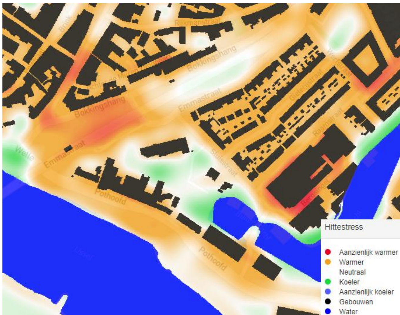
Figuur 4 Kaartbeeld bestaande Hittestress rond het plangebied.

In de watertoets is aangegeven dat er geen verhard oppervlak bij komt. Met het oog op de toekomst en de hittekaart (figuur 4) geven wij vanuit het waterschap het advies om een deel van het (toekomstige) verharde om te zetten naar natuur.