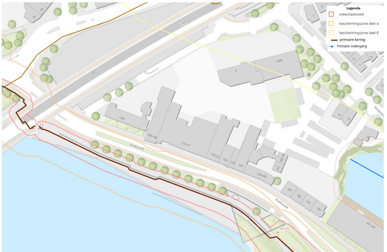
Figuur 3 Kaartbeeld bestaande beschermingszones voor de primaire waterkering langs het plangebied.