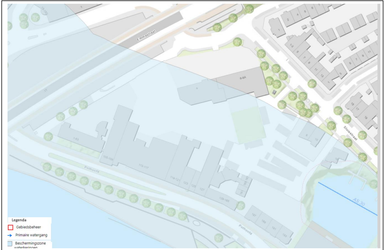
Figuur 1 Kaartbeeld bestaande waterhuishouding rond het plangebied, ten zuiden van het gebied ligt de IJssel dit valt onder Invloedzone grote rivieren, ten oosten ligt een kanaal waaromheen met rood gearceerd een beheer en onderhoud strook is aangegeven circa 5 meter.

Het plan ligt in het stroomgebied Overijsels Kanaal (Deventer). Rond het plangebied ligt de primaire watergang AS 30 en rivier de IJssel die in het beheer van het waterschap zijn. Het peilgebied heeft een maximumpeil van NAP +5,75 m. Dit peil is de instelhoogte van het kunstwerk. Lokaal kunnen er verschillen optreden in het peil afhankelijk van de afstand tot de instelhoogte.