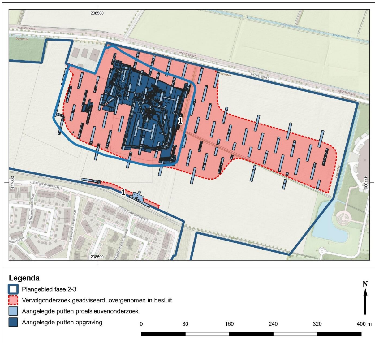
Afb. 2: Overzicht van onderzochte delen van het plangebied.

De opgraving liep van februari t/m de eerste week van mei. De vooraf gedefinieerde vindplaatsen zijn hierbij volledig opgegraven. Vindplaats 1 betrof inderdaad een vermoedelijk mesolithische kampplaats met een cluster haardkuilen en een strooiing van vuurstenen artefacten en bewerkingsafval. Deze strooiing is nader onderzocht door middel van het structureel zeven van deze deelvindplaats. Vindplaats 3 kan inderdaad worden geïnterpreteerd een ontginningserf uit de nieuwe tijd, bestaande uit een groot aantal (ontginnings)greppels, bestaande uit minimaal vijf fasen, en verschillende sporen van gebouwen en bewoning. Zo zijn meerdere afvalkuilen, paalkuilen en drie waterputten aangetroffen. Vindplaats 2, die als mogelijke dassenburcht was gekenmerkt, bleek inderdaad een omvangrijke dassenburcht te zijn, met een waarschijnlijke datering in de late prehistorie. Waarschijnlijk is zelfs sprake van minimaal twee dassenburchten in het onderzoeksgebied.