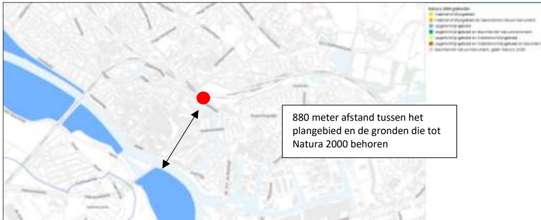
Ligging van Natura 2000-gebied in de omgeving van het plangebied. De ligging van het plangebied wordt met de rode stip aangeduid. Gronden die tot Natura 2000 behoren worden met de donkerblauwe kleur aangeduid.