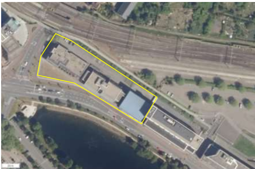
Begrenzing van het plangebied wordt met de gele lijn aangeduid

Het plangebied bestaat volledig uit bebouwing en erfverharding. In het plangebied staan drie gebouwencomplexen met meerdere bouwlagen. De gebouwen zijn gebouwd van bakstenen, de zijgevels zijn deels bekleed met damwand en leien en de gebouwen hebben allen een plat dak. Op onderstaande luchtfoto wordt de begrenzing van het plangebied weergegeven. Op onderstaande afbeelding wordt de begrenzing van het plangebied weergegeven.