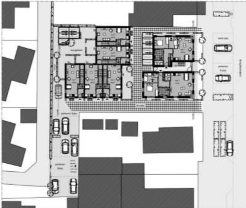
Verbeelding van het wenselijk eindbeeld

Er zijn plannen om nieuwe woningen te realiseren in het plangebied. De bestaande winkel wordt intern verbouwd tot zes appartementen en er worden vijf geschakelde woningen gebouwd. Om deze geschakelde woningen te kunnen realiseren dient de aanbouw gesloopt te worden. Tevens worden er enkele parkeerplaatsen gerealiseerd. Aangenomen wordt dat de haag wordt verwijderd en dat een deel van de bestaande erfverharding verwijderd en vervangen wordt. Het erf wordt nadien landschappelijk ingepast d.m.v. de aanplant van erfbeplanting. Op onderstaande afbeelding wordt een plattegrond van het wenselijk eindbeeld weergegeven.