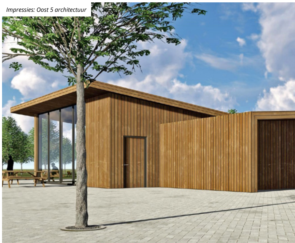
Impressies: Oost 5 architectuur

prachtige aanwinst zijn. De Omgevingswet biedt in de toekomst zeker ruimte aan dergelijke bewonersinitiatieven. [REDACTED] : "Door zo'n proces door een onafhankelijke partij te laten begeleiden, help je alle belanghebbenden." ■