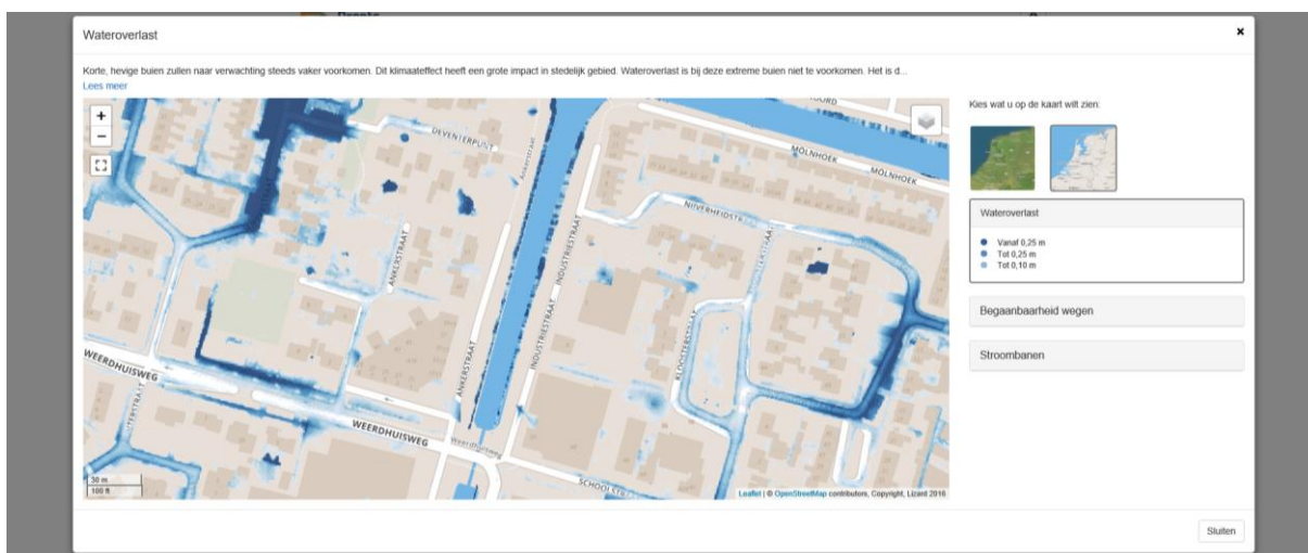
Figuur 2. Wateroverlast