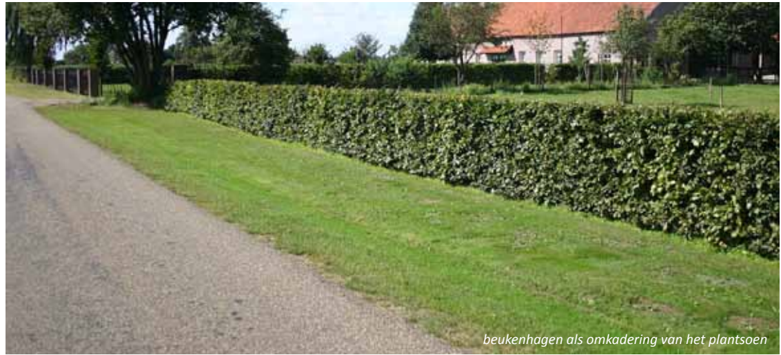
beukenhagen als omkadering van het plantsoen