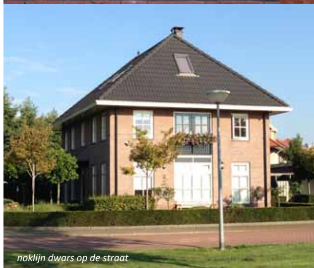
noklijn dwars op de straat