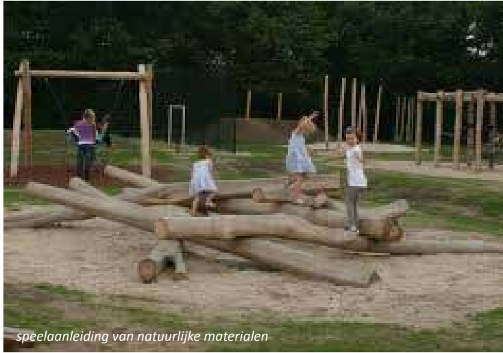
speelaanleiding van natuurlijke materialen