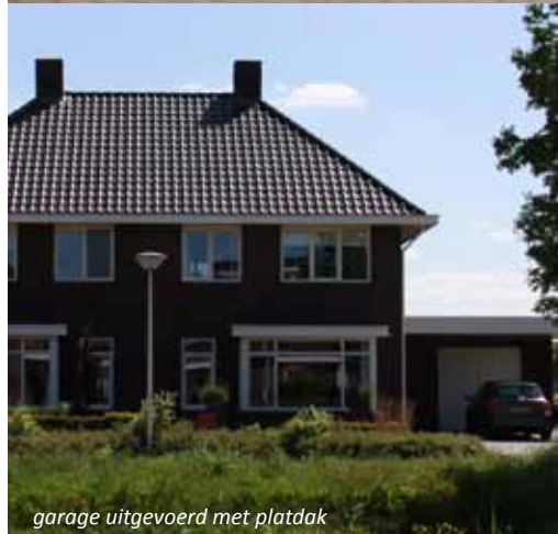
garage uitgevoerd met platdak