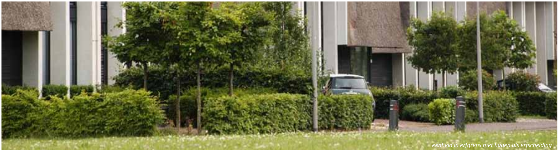
eenheid in erfgrans met hagen als erfscheiding

Referentiebeelden zijn indicatief en bedoeld ter inspiratie.