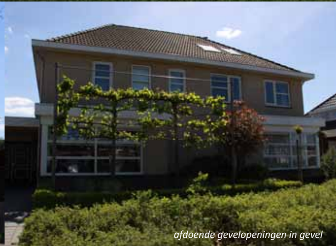
afdoende gevelopeningen in gevel

Referentiebeelden zijn indicatief en bedoeld ter inspiratie. Beelden van: eigen foto's Nieuwe Landen I