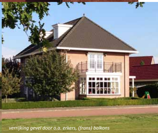
verrijking gevel door o.a. erkers, (frans) balkons