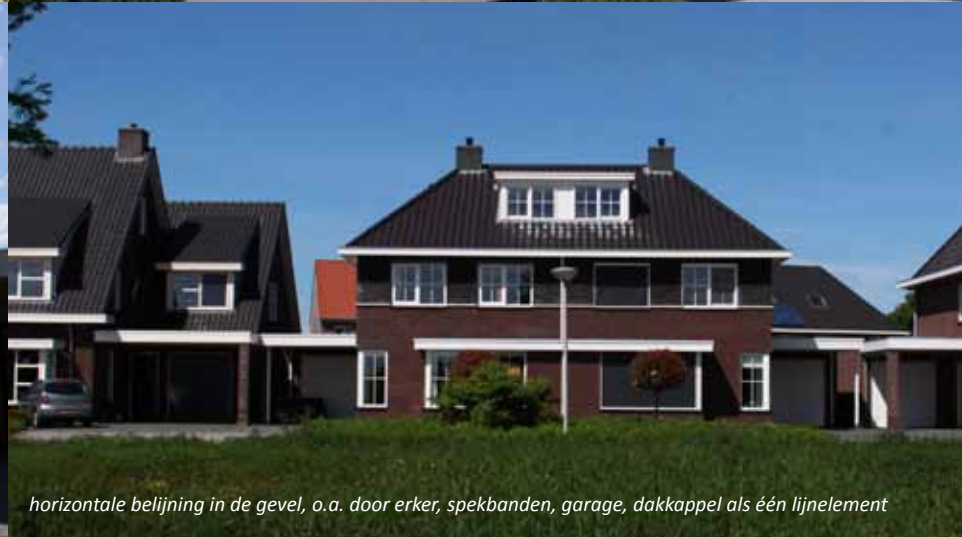
horizontale belijning in de gevel, o.a. door erker, spekkanden, garage, dakkappel als één lijnelement