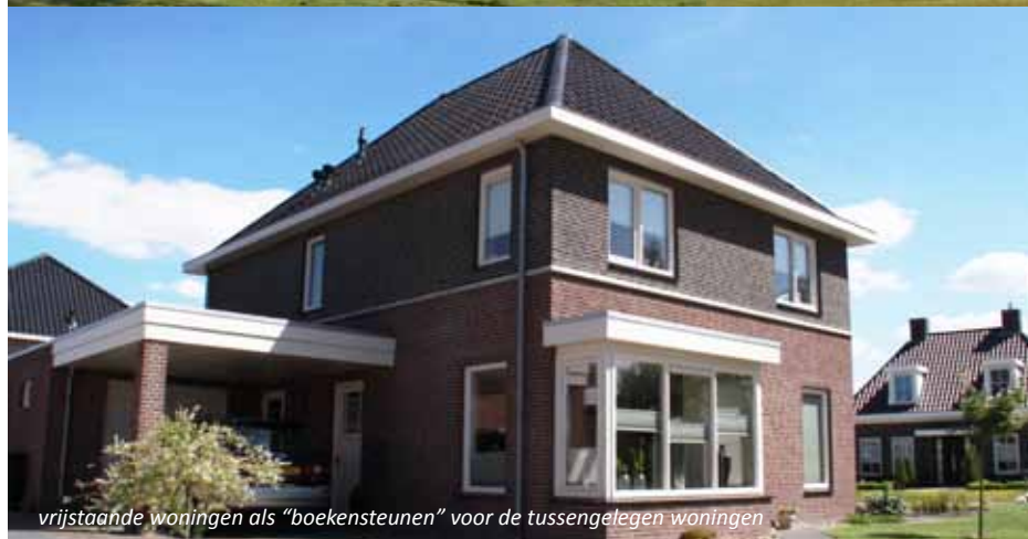
vrijstaande woningen als "boekensteunen" voor de tussengelegen woningen