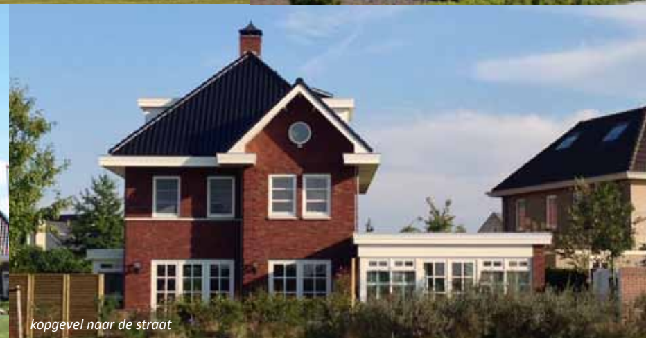
kopgevel naar de straat

Referentiebeelden zijn indicatief en bedoeld als inspiratie.