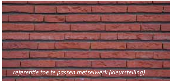
referentie toe te passen metselwerk (kleurstelling)