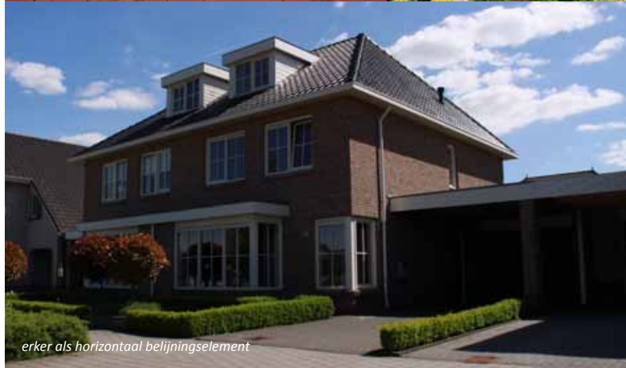
erker als horizontaal belijningselement