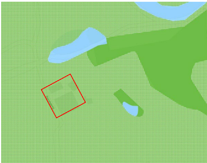
De ligging van het erf ten opzichte van onderdelen van het natuurnetwerk (groen en blauw). De groene arcering is de aanduiding voor de Zone ondernemen met natuur en water.

Het erf ligt buiten het natuurnetwerk (NNN), maar ten noorden en ten oosten liggen enkele kleinschalige beschermde natuurelementen. Het erf ligt in gebied dat wordt aangeduid als Zone ondernemen met natuur en water.