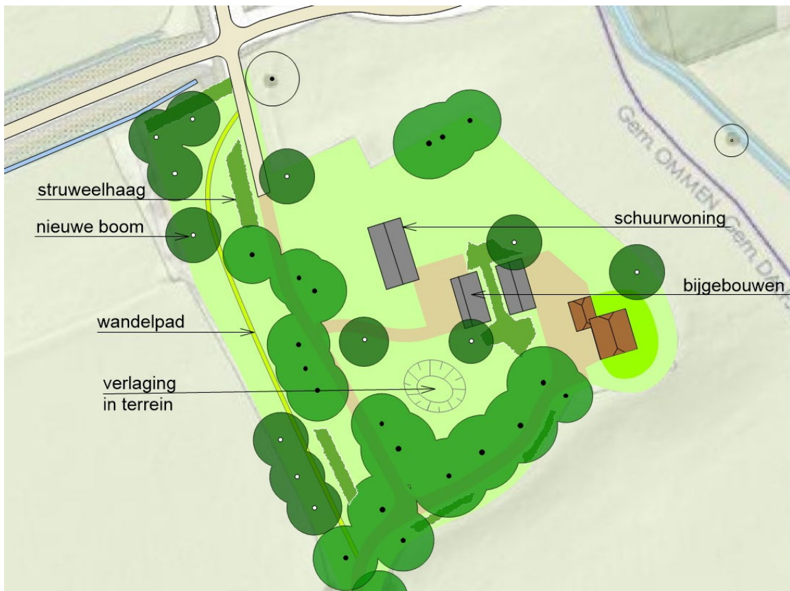
Inrichtingsschets Baarslagweg 2 Dalfsen.