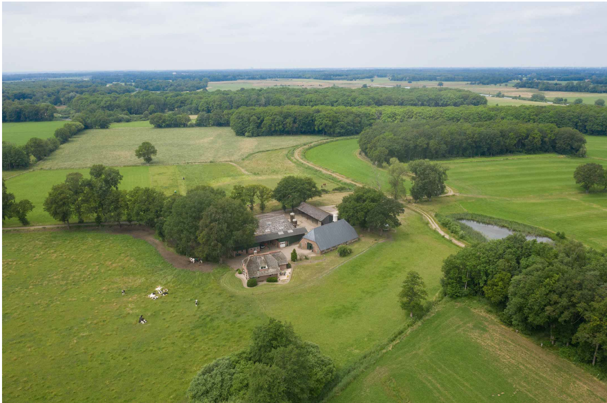
Luchtfoto van het erf Baarslagweg 2 Dalfsen (Bron: Poortman Makelaars Staphorst).

Datum : 26 januari 2022 Onderwerp: Rood voor rood Fase: Initiatief