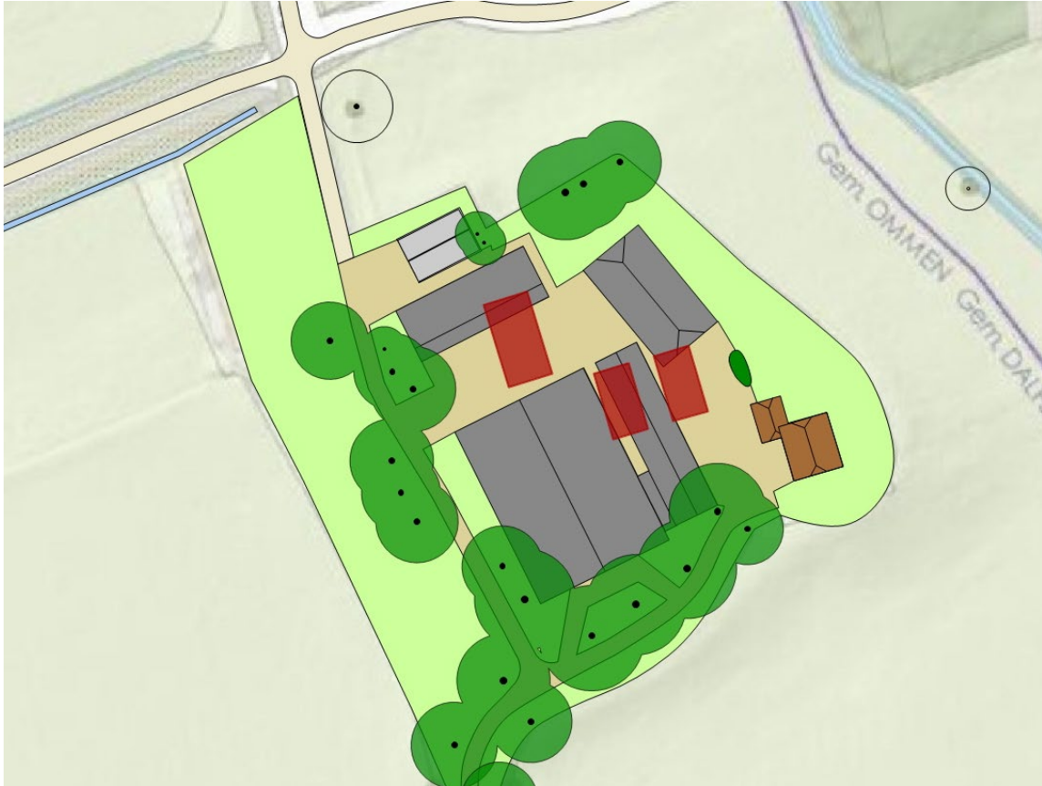
Huidige situatie met de locatie van de nieuwe bebouwing (rood)