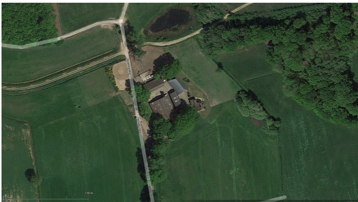
Huidige situatie. Luchtfoto met de openbare Baarslagweg langs het erf.