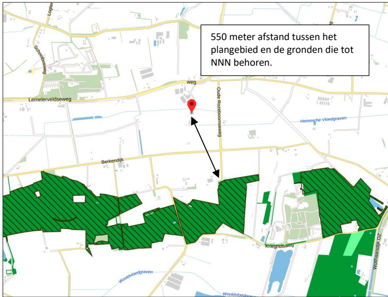
Ligging van Natuurnetwerk Nederland in de omgeving van het plangebied. De ligging van het plangebied wordt met de rode marker aangeduid. Gronden die tot Natuurnetwerk Nederland behoren worden met de groene kleur op de kaart aangeduid.