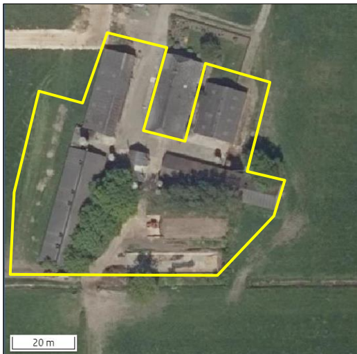
Begrenzing van het onderzoeksgebied.

Omdat er geen fysieke activiteiten worden uitgevoerd in een deel van het plangebied, is dat deel niet onderzocht in het kader van dit onderzoek. Op onderstaande luchtfoto wordt het onderzoeksgebied aangeduid met de gele lijn. Indien in dit rapport gesproken wordt over plangebied, dan wordt onderstaand onderzoeksgebied bedoeld.