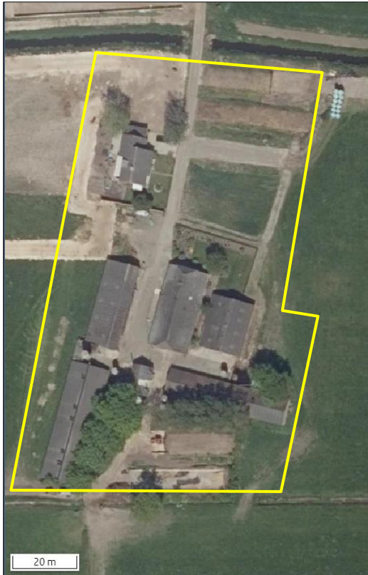
Begrenzing van het plangebied; deze wordt met de gele lijn aangeduid.