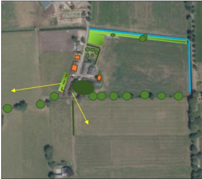
Verbeelding van het wenselijke eindbeeld.

Het voornemen bestaat om de agrarische activiteiten binnen vijf jaar volledig staken en een extra woning te bouwen op het erf. Deze ontwikkeling wordt gefaseerd uitgevoerd. Ten eerste wordt de varkenshouderij gestaakt en de varkensstallen gesloopt en wordt ter plaatse één woning met bijgebouw gebouwd. Over enkele jaren worden de resterende agrarische activiteiten gestaakt en wordt de overtollige agrarische bebouwing gesloopt. De oude boerderij blijft behouden. Het erf landschappelijk ingepast met diverse beplanting. Op onderstaande afbeelding wordt een verbeelding van het wenselijke eindbeeld weergegeven.