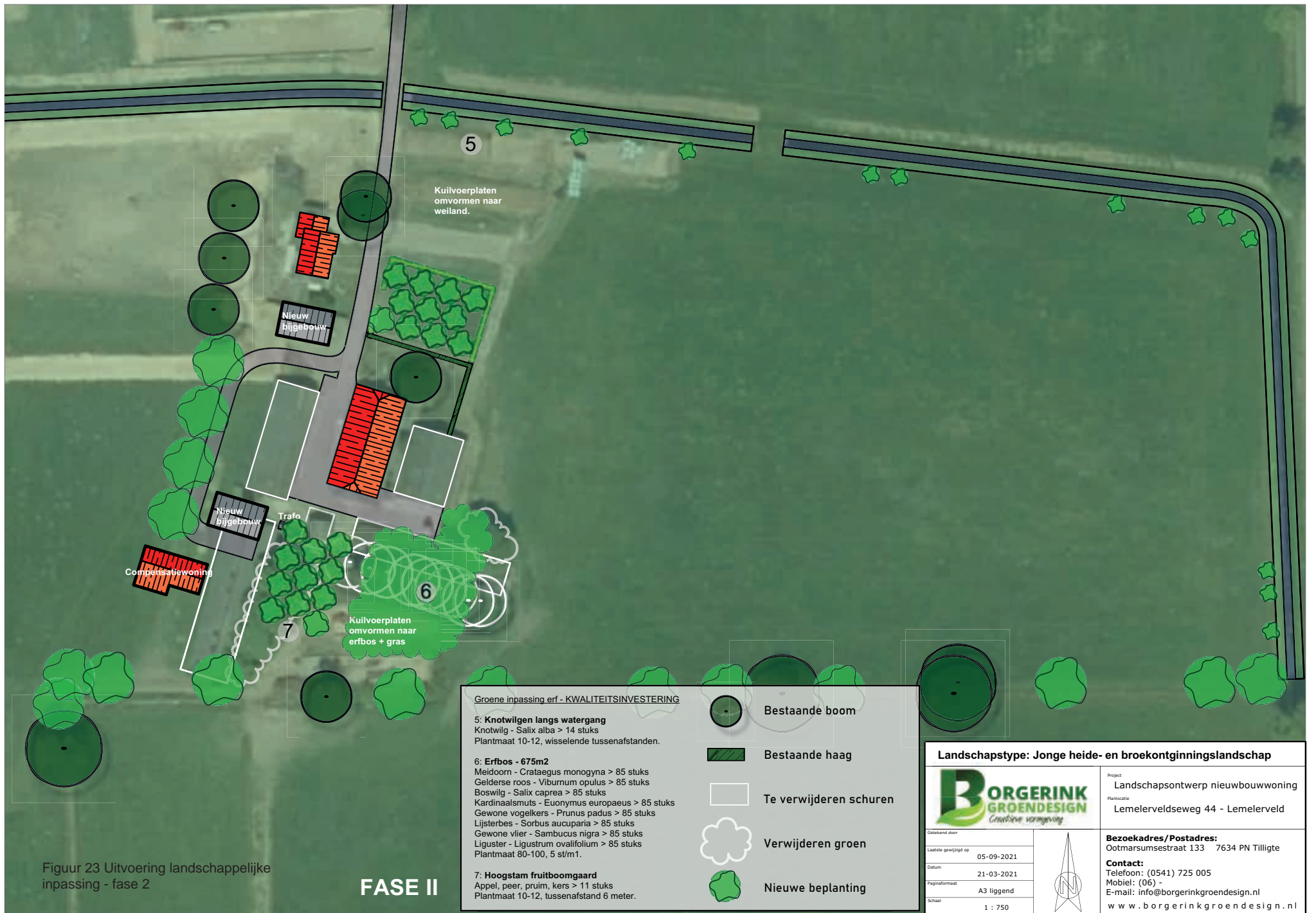
Figuur 23 Uitvoering landschappelijke inpassing - fase 2