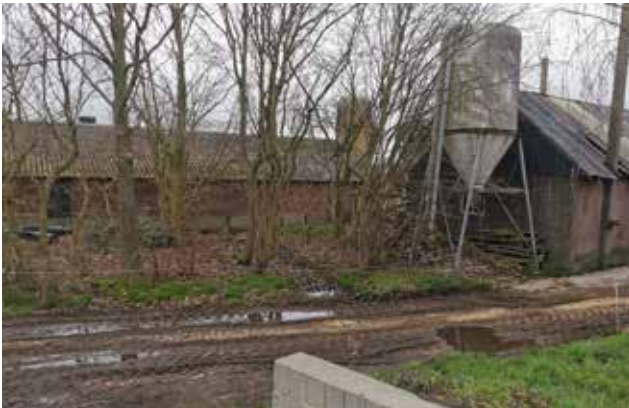
Figuur 12 Erfbos op het ab tererf.