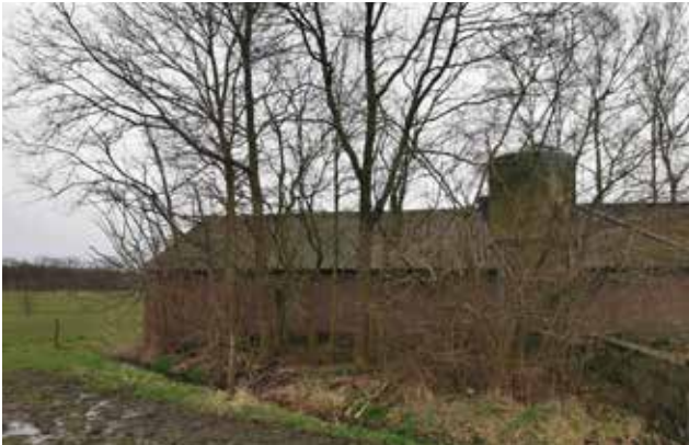
Figuur 9 Erfbeplanting van sleb te kwaliteit nabij de sb uren.