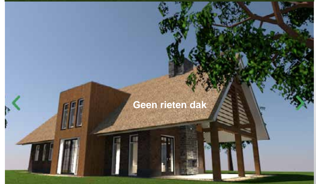
Rood voor Rood - Ruimtelijk kwaliteitsplan - Lemelerveldseweg 44 Lemelerveld