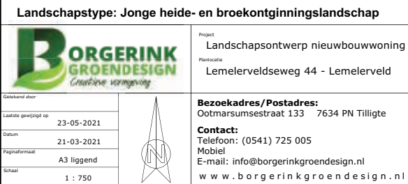
Figuur 22 Uitvoering landsb appelijke inpassing - fase 1

Groene inpassing erf - KWALITEITSINVESTERING 1: Bomenrij langs perceelsrand Zomereik - Quercus robur > 4 stuks Plantmaat 14-16, tussenafstand 12 m. 2: Haag - 60 meter Liguster - Ligustrum ovalifolium > 300 stuks Plantmaat 80-100, 5 st/m1. 3: Hoogstam fruitboomgaard Appel, peer, pruim, kers > 11 stuks Plantmaat 10-12, tussenafstand 6 meter. 4: Bomenrij (mix) langs perceelsrand Zomereik - Quercus robur > 5 stuks (Q) Ruwe berk - Betula pendula > 3 stuks (B) Zwarte els - Alnus glutinosa > 4 stuks (A) Plantmaat 14-16, variërende tussenafstanden. ● Bestaande boom ▨ Bestaande haag □ Te verwijderen schuren ● Bestaand groen ● Nieuwe beplanting