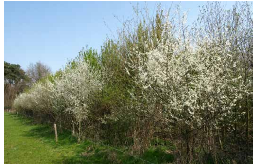
Figuur 21 Erfbos op het ab tererf