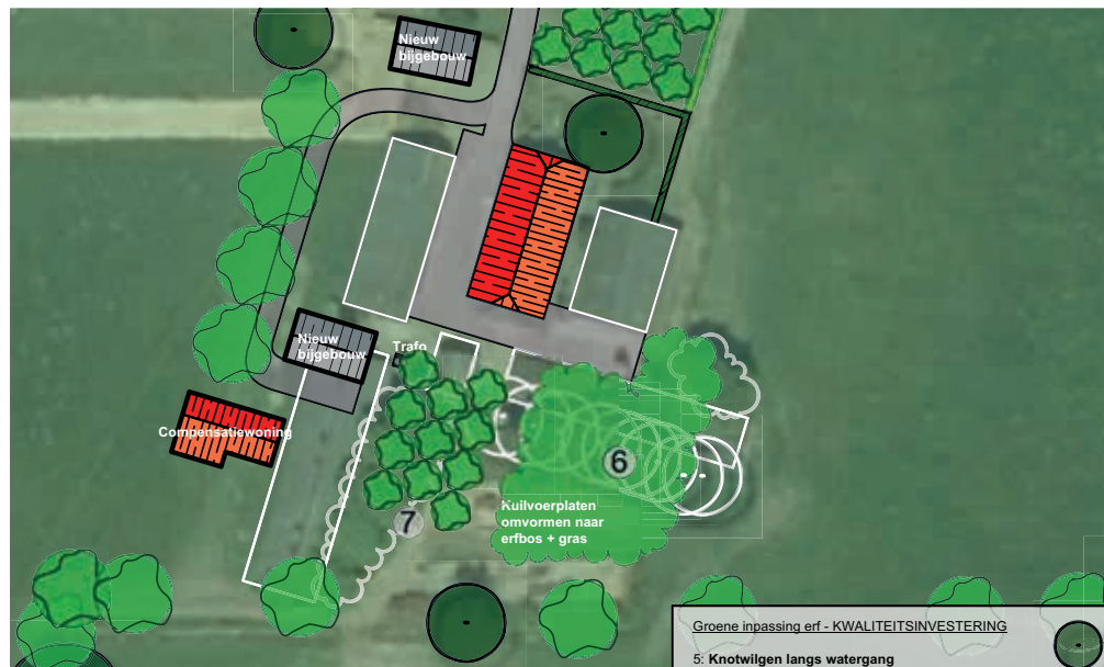
Figuur 15. Positionering compensatiewoning (linksonder) versus bestaande woning (midden)