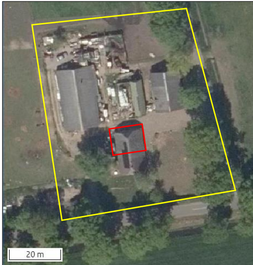
Begrenzing van het plangebied (gele lijn) en onderzoeksgebied (rode lijn).