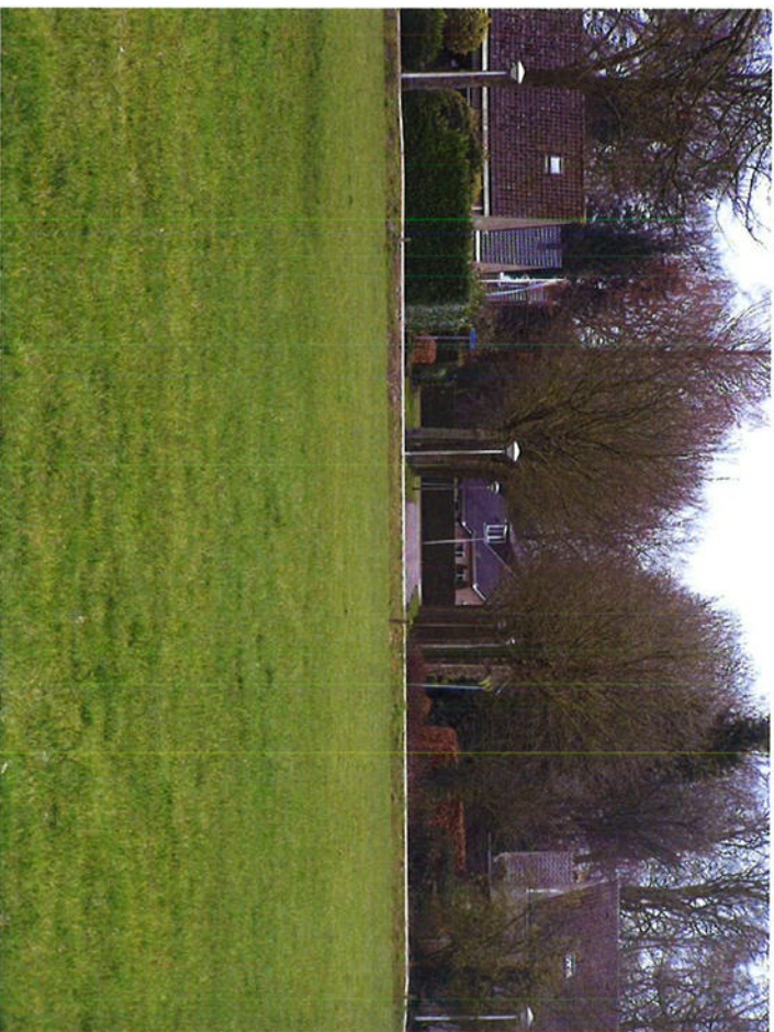
Kruising Leemculeweg – Esdoorrilaan

De toegangsweg naar het erf wordt verlegd en aangesloten op de Esdoorrilaan. Hiermee wordt bereikt dat aanwonenden aan de Leemculeweg geen hinder ondervinden van in- en uitrijdend verkeer. De vormgeving van de toegangsweg wordt zo gekozen dat het voor het verkeer duidelijk is dat het een uitrit betreft. Dit gebeurt door de beperkte breedte, afwijkend materiaal- en kleurgebruik en het plaatsen van palen en/of een toegangshek.