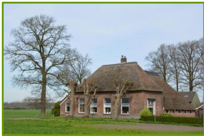
Voorgevel woonboerderij met knotlinden, buxushaag, solitaire eiken (links), en eikengarde (rechts).

Schaal 1:500 Versie 3 Datum 8 oktober 2017