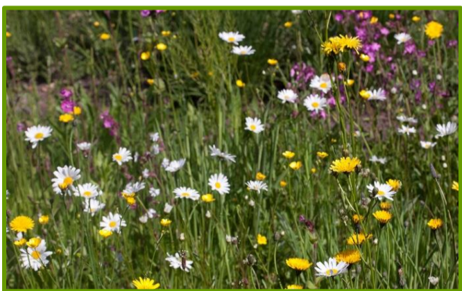
Voorbeeld bloemrijk grasland (extensief)