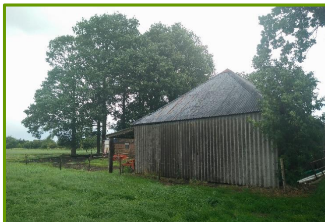
Zijkant hooischuur betimmeren met zwart potdeksel