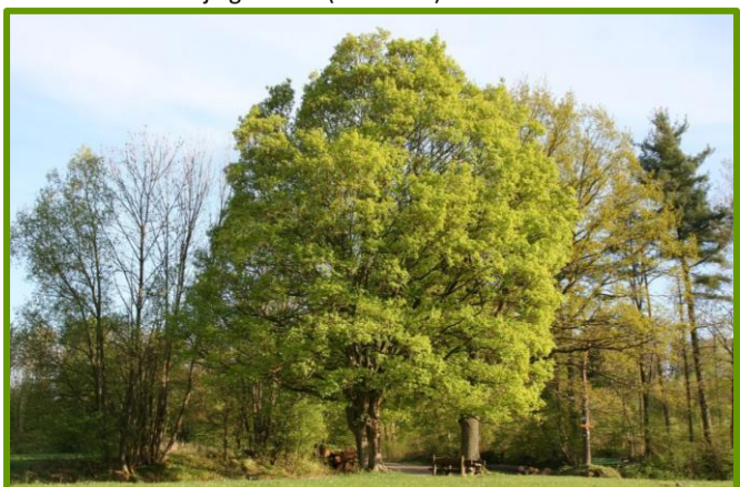
Voorbeeld solitaire boom: Veldesdoorn (Spaanse aak)