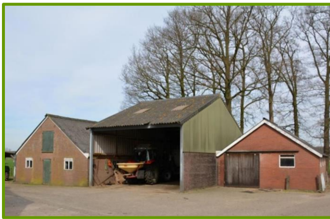
Bijgebouwen met op de achtergrond de eikengarde.