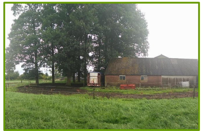
Westzijde 'varkensstal' met eikengarde