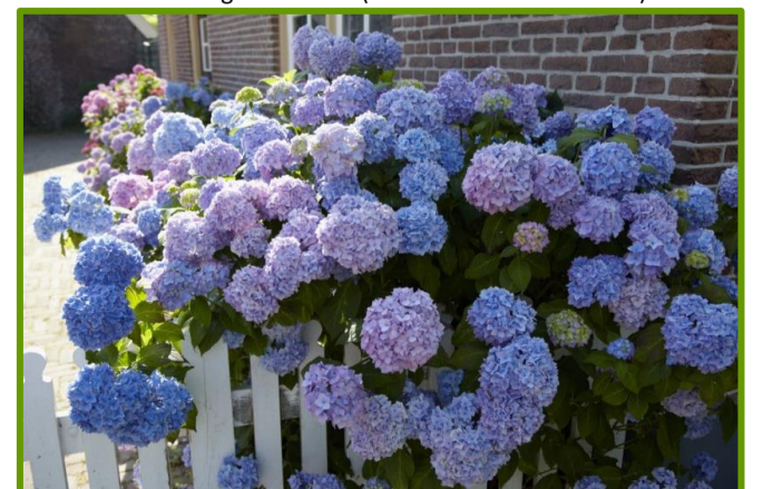
Voorbeeld boerenhortensia voor woning