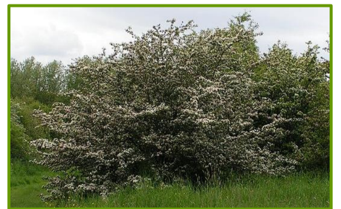
Voorbeeld streekeigen struiken (hier bloeiende meidoorn)