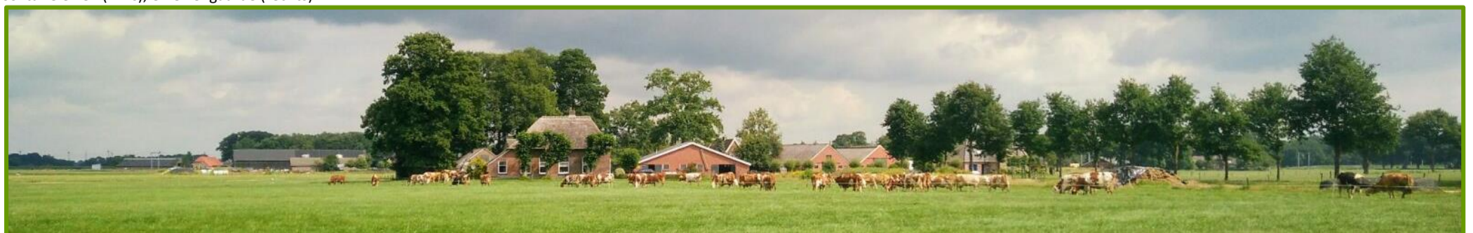
Woonboerderij gezien vanaf de N757. Links solitaire eiken, achter de opstallen de eikengarde, knotlinden voor de gevel en rechts de Poppenallee met enkele bomen.