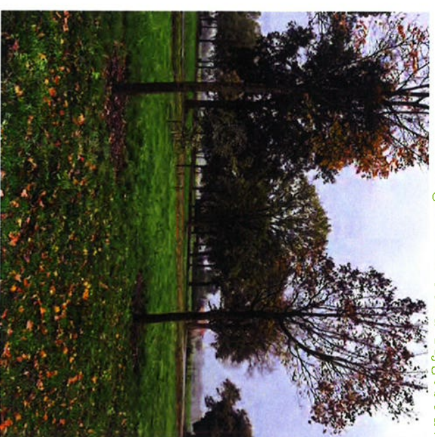
bestaande bomen op het erf