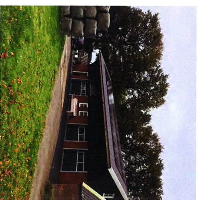
recent gerenoveerd bijgebouw