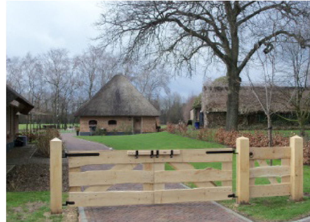
landhek als ruimtelijke scheiding tussen 'bedrijfserf' en privaaterf