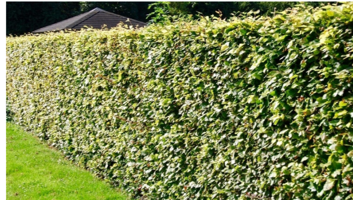
haagstructuren inzetten als ruimtelijke scheiding tussen 'bedrijfserf' en privaaterf, soort beukenhaag