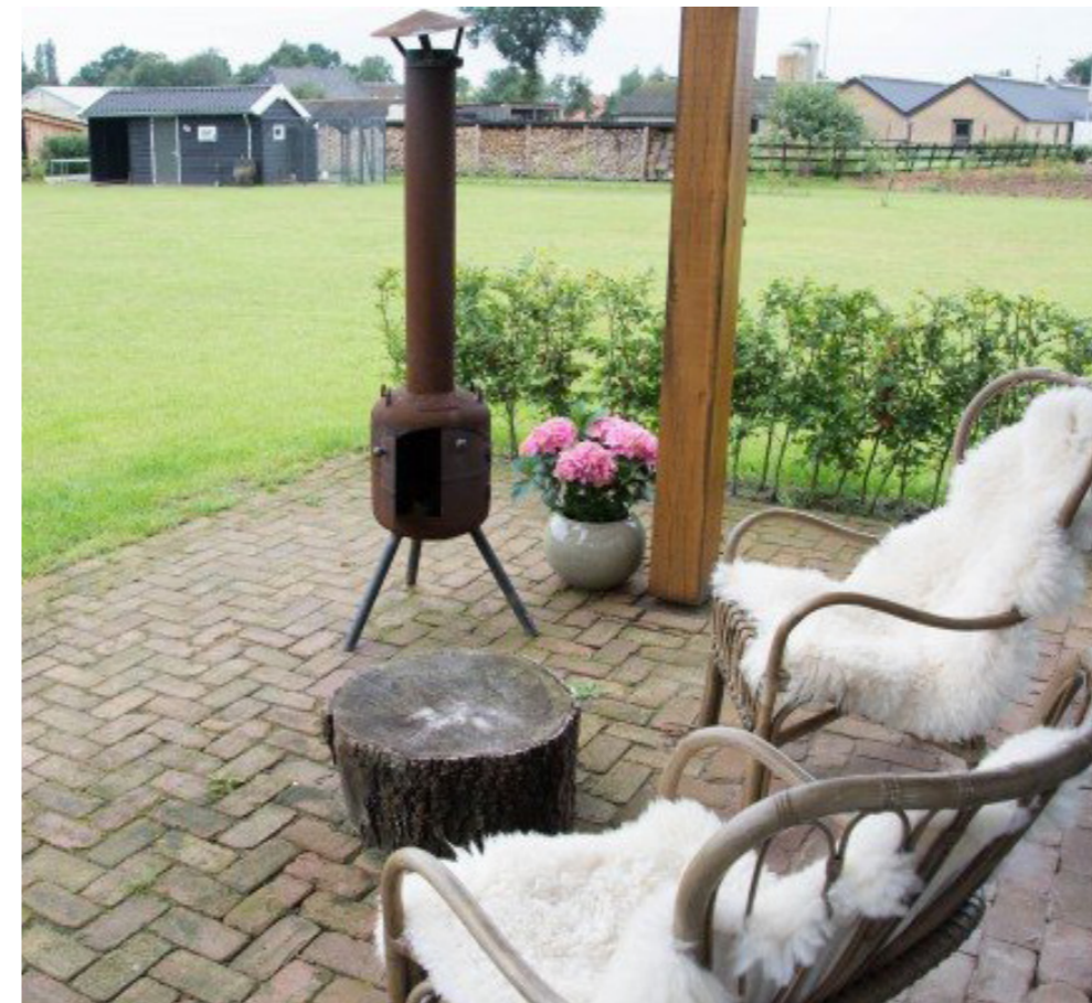
sfeer van de terrassen met gebakken klinker en omzoomd door hagen