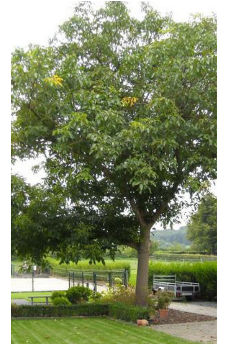
inpassen solitair, walnoot