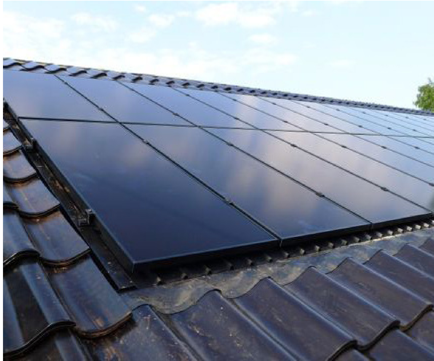
zonnepanelen inpassen op dakvlak groepsaccommodatie (westelijke zijde)

referentiekader | formaat A3 | 21-12-2017