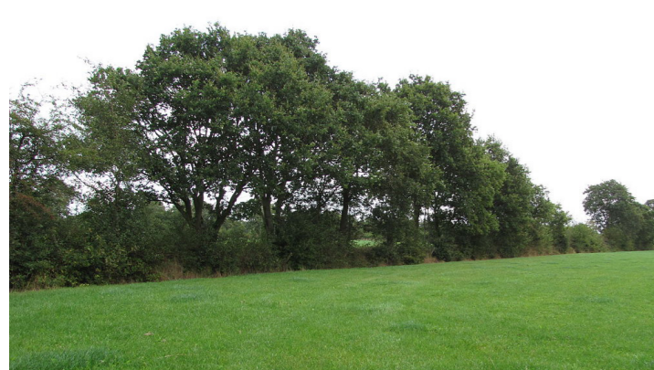
singelbeplanting inzetten als ruimtelijke scheiding tussen 'bedrijfserf' en privaaterf en singel langs laantje doorzetten tot entree, streekeigen soorten