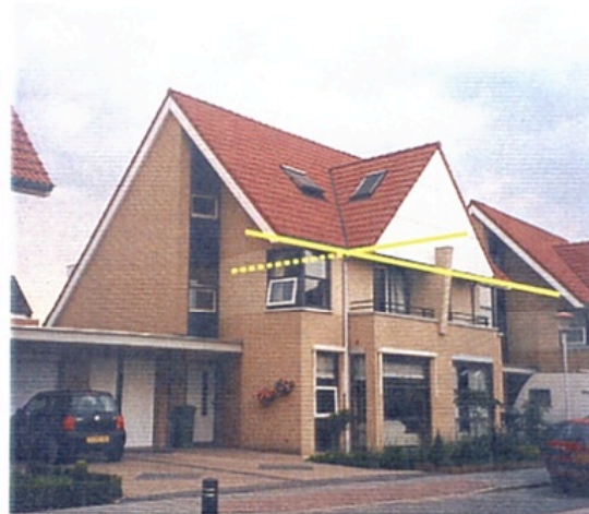
Kniklijn op voor-, achter- en zijgevels