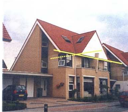
Kniklijn op voor-, achter- en zijgevels