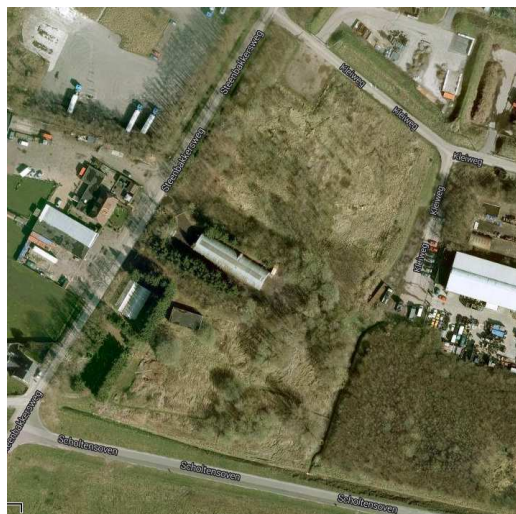
Figuur 1 - huidige situatie voormalige vuilstort

Op 7 juni is in een motie van de fracties Borne-Nu, GB90, CDA, PVDA, D66 en VVD opgeroepen tot de sanering van stortgat 2 aan de Steenbakkersweg. Daarin is ook gesteld dat het gebied voorlopig niet in exploitatie wordt genomen en, indien mogelijk, voor duurzaam recreatief gebruik open wordt gesteld. Binnen het kader 'duurzaam recreatief' wordt een nieuwe subsidieovereenkomst gesloten volgens de verdeelsleutel dat 63,5% van de kosten door de provincie worden gefinancierd. Het college is opgeroepen € 250.000,- beschikbaar te stellen voor de sanering en het opstellen van een saneringsplan. Voor de duurzaam recreatieve inrichting zijn geen middelen beschikbaar gesteld en moest ook nog een verdere uitwerking worden gemaakt. Om die reden is een project gestart om inzichtelijk te maken wat, binnen de gegeven uitgangspunten, een geschikte inrichting voor het stortgat zou kunnen zijn en wat de kosten van deze inrichting zijn. In dit inrichtingsplan wordt deze inrichting met bijbehorende kosten inzichtelijk gemaakt. In figuur 1 is de huidige situatie van de voormalige vuilstort te zien.