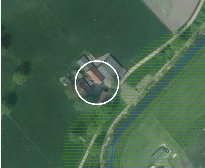
Ligging van de zone 'ondernemen met natuur en water buiten de EHS' in de omgeving van onderzoeksgebied (cirkel) weergegeven.