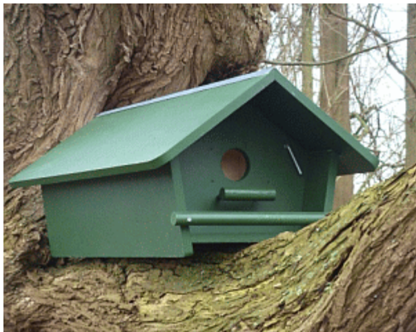
Afbeelding van een marterproof Steenuilenkast (zie: www.steenuil.nl/nestkasten )