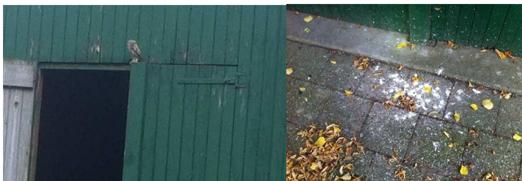
Steenuil en 'gebruikssporen' van de Steenuil (schijt en braakballen)

Op het erf is een territorium van de steenuil gevestigd. De gebouwen die gedekt zijn met golfplaat en geïsoleerd zijn met hardschuimen panelen vormen een potentiële broedplaats voor Steenuil. Aan de voorzijde van de boerderij staat een oude appelboom met een ingerotte stam. Mogelijk bevindt zich in deze boom een natuurlijke nestplaats van de Steenuil. Deze holte is niet visueel geïnspecteerd op de aanwezigheid van een nestplaats.