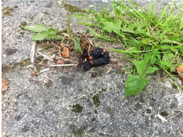
Keutel van steenmarter, gevonden op het erf.

verblijfplaatsen van deze soorten in het gebied waargenomen, maar de holle ruimte tussen de golfplaten en de hardschuimen isolatiepanelen in de schuren vormt een geschikte verblijfplaats voor steenmarters, evenals rommelhoekjes en (oude) hooi(balen) op zolders. De holle ruimte onder de golfplaten is vanaf de buitenzijde niet goed te beoordelen op de aanwezigheid van een vaste verblijfplaats van Steenmarters. Op het erf is een keutel van een steenmarter gevonden zodat rekening moet worden gehouden met de aanwezigheid van deze soort op het erf.