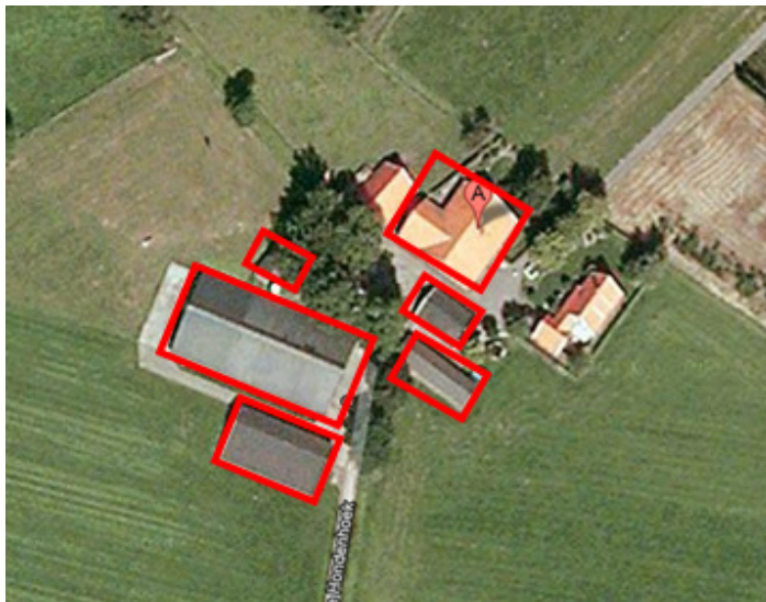
Weergave van de te slopen bebouwing in het plangebied. De te slopen bebouwing wordt met de rode contour aangeduid.