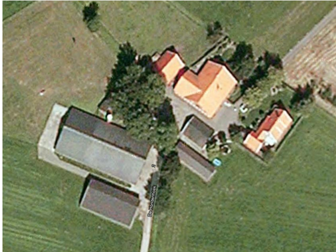
Detailopname van het plangebied. Het plangebied wordt met de gele contour aangeduid.