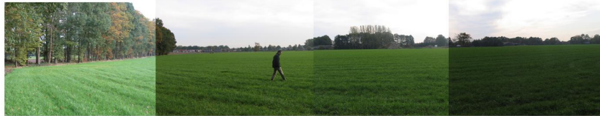
Afbeelding 2: Impressie plangebied. Boven: locatie voor uitbreiding agrarisch bouwvlak, onder: locatie voor bouw van woonhuis.