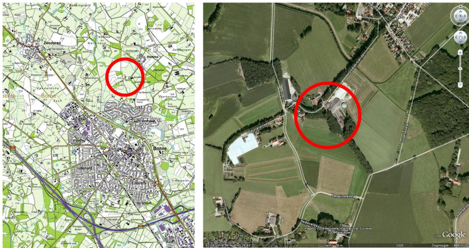
Afbeelding 1: links, uitsnede uit topografische kaart (1:25.000). Rechts, luchtfoto. De rode cirkels geven de ligging van het plangebied weer.

In Borne (gemeente Borne, provincie Overijssel) bestaat het voornemen om aan de Lodiek Landen het agrarisch bouwvlak van een bedrijf te vergroten ten behoeve van het verder ontwikkelen van het agrarisch bedrijf. Verder wordt nog de bouw van een bedrijfswoning beoogd. Eén van de haalbaarheidsstudies die hiervoor dient te worden uitgevoerd is toetsing aan de natuurregelgeving. Voorliggende quick scan flora en fauna is opgesteld door SAB Arnhem B.V. en geeft een eerste inzicht in de doorwerking van de natuurwetgeving in het plangebied.