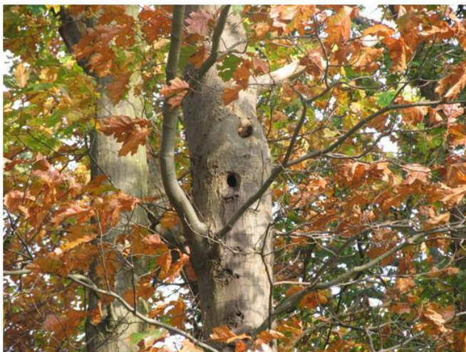
Afbeelding 4: Spechtengaten in Amerikaanse eik ( Quercus rubra )

Sommige vogelsoorten zoals uilen en spechten gebruiken hun nesten jaarrond als verblijfplaats. Ook buiten het broedseizoen hebben nesten van deze vogels een beschermde status. Tevens zijn nesten van in bomen broedende roofvogels jaarrond beschermd.