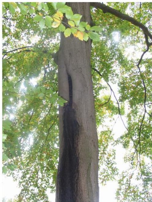
Afbeelding 3: mogelijke vaste- rust en verblijfplaats van vleermuizen

schikt zijn als foerageergebied. Negatieve effecten van de beoogde plannen op (vaste rust- en verblijfplaatsen, vliegroutes of foerageergebieden) van boombewonende vleermuissoorten zijn niet op voorhand uit te sluiten.