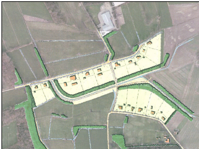
figuur 1. plangebied

In het buitengebied op de grens van de gemeenten Borne en Hengelo worden 15 nieuwe woningen gerealiseerd ter hoogte van de Hemmelhorst (zie figuur 1). Het betreft hier de verplaatsing van woningen die moeten wijken voor toekomstige stedelijke ontwikkelingen binnen de gemeenten Borne en Hengelo.