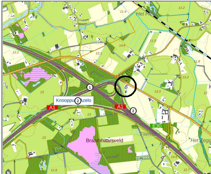
Globale ligging van het plangebied. De globale ligging wordt aangeduid met de cirkel (bron kaart: Provincie Overijssel).

Het plangebied is gesitueerd op het adres Bornerbroeksestraat 107 te Borne. Het ligt in het buitengebied, circa 2,1 kilometer ten westen van de kern Borne. Op onderstaande afbeelding wordt de globale ligging van het plangebied aangeduid met de cirkel.