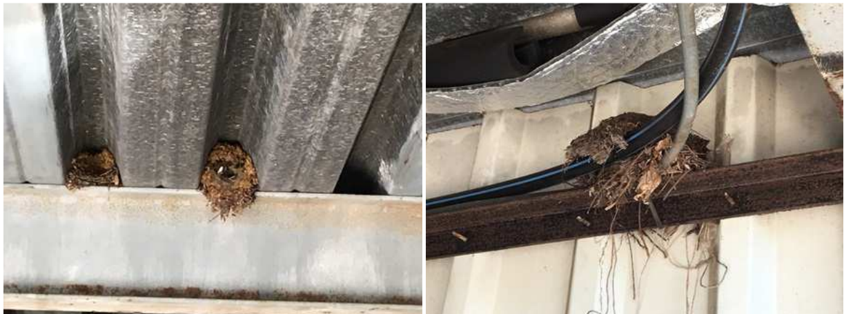
Oude en verlaten vogelnesten in het plangebied. Links; winterkoning, rechts; merel.

Door het rooien van beplanting en het slopen van bebouwing tijdens de voortplantingsperiode, worden mogelijk bezette nesten beschadigd en vernield en worden mogelijk eieren vernield en (jonge) vogels verwond en gedood. De functie van het plangebied als foerageergebied behouden na planrealisatie.