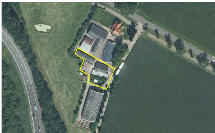
Detailweergave en begrenzing van het plangebied. De begrenzing van het plangebied wordt met de gele lijn.

Het plangebied vormt een deel van een bestaand erf en bestaat uit erfverharding, bebouwing en natuurlijke opslag van berk, vlier en brandnetel. In het plangebied staan vijf bijgebouwen met een gezamenlijke oppervlakte van 617 m 2 . De bebouwing bestaat uit kapschuren en een stenen schuur. Géén van de gebouwen beschikt over een (holle) wand, spouw, dak- of wandisolatie. De gebouwen waren tijdens het veldbezoek in gebruik als opslagplaats van caravans en natuursteen. Op onderstaande afbeelding wordt het plangebied in detail weergegeven.