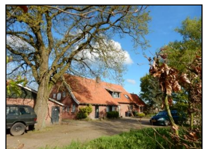
Figuur 8. Woonboerderij vanaf zuid-oostzijde.