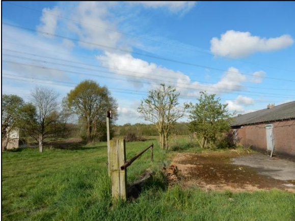
Figuur 11. Het habitat op de onderzoekslocatie vormt een geschikt leefgebied voor de steenuil en de kerkuil.