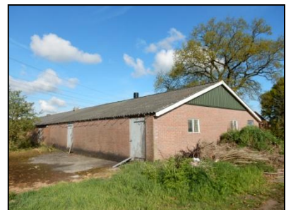
Figuur 5. Eén van de schuren.