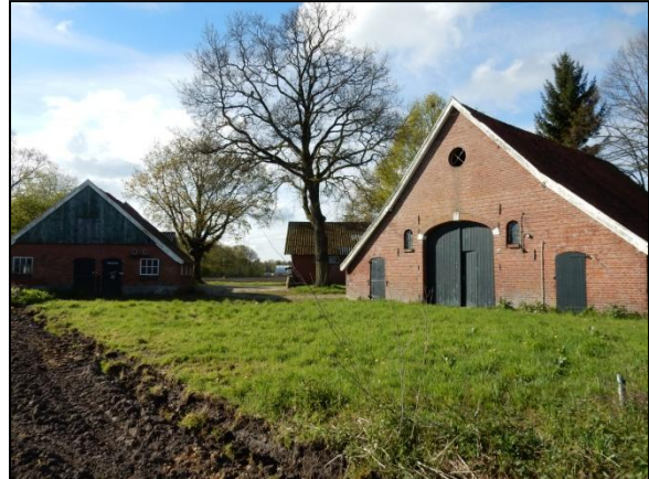
Figuur 12. Het naastgelegen erf vormt een geschikt habitat voor kerk- en steenuil, mogelijk ook om te broeden.

In geval van aanwezigheid van de wat grotere kerkuil, zijn sporen meestal wel aan te treffen. Gelet op het ontbreken hiervan kan worden aangenomen dat deze soort geen vaste rust- en verblijfplaats op het erf heeft. De kerkuil heeft een groot leef- en foerageergebied. Mocht er op één van de erven in de directe omgeving een broedgeval aanwezig zijn (zie figuur 12), dan heeft de aanleg van het crematorium daarop effect. De soort komt in de omgeving voor (zie hoofdstuk 6).