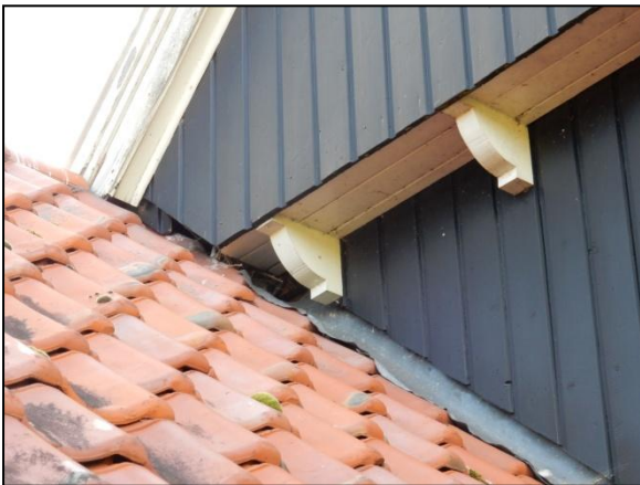
Figuur 13. Ruimte onder dakpannen en daklood bieden potentiële verblijfplaatsen aan vleermuizen.

De bebouwing op de onderzoekslocatie is in principe geschikt als verblijfplaats voor vleermuizen, vanwege de aanwezigheid van geschikte openingen als ruimte bovenaan gevels, tussen dakpannen en onder daklood. Voornamelijk is de woonboerderij geschikt voor de gewone dwergvleermuis, gewone grootoorvleermuis en de laatvlieger. Deze soorten kunnen de bebouwing in principe gebruiken als zomerverblijf, kraamverblijf en als baltsverblijf (zie hoofdstuk 6).