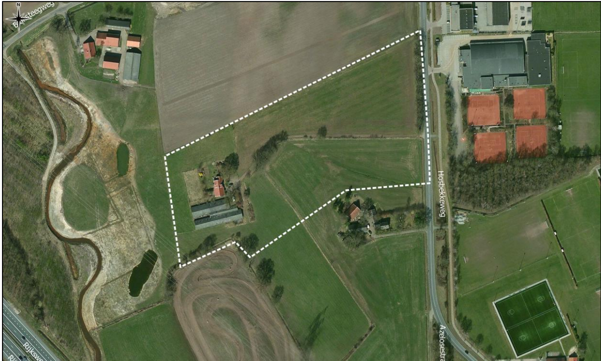
Figuur 2. Luchtfoto onderzoekslocatie en directe omgeving.