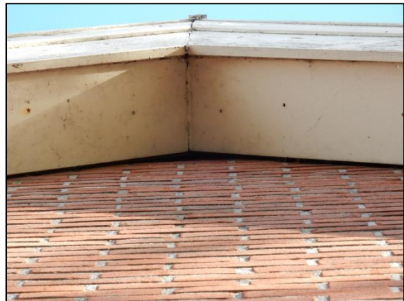
Figuur 14. Ruimte tussen de gevel en de dakrand van het woonhuis.