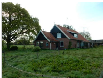
Figuur 4. Woonboerderij.