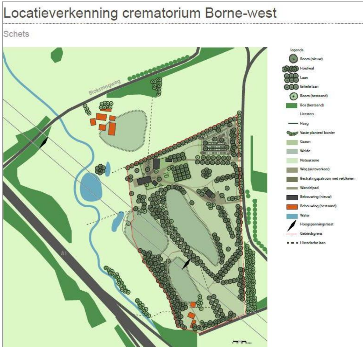
Figuur 10. Indicatieve locatieschets toekomstige inrichting (bron: Gemeente Borne).

De initiatiefnemer is voornemens een crematorium te realiseren op de onderzoekslocatie. De bestaande bebouwing zal hiervoor worden gesloopt. Er worden bomen geplant en er wordt een parkeerplaats aangelegd. In figuur 10 is een indicatie van de inrichting opgenomen.