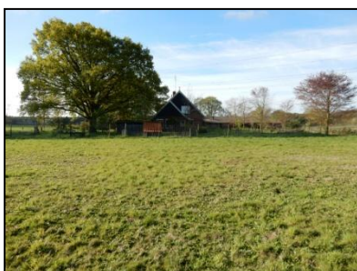
Figuur 6. Erf met weideperceel op voorgrond.