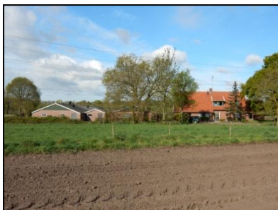
Figuur 3. Overzicht erf.