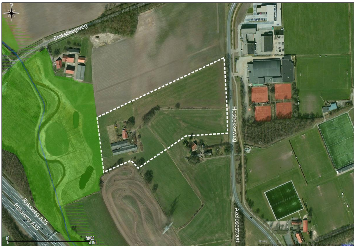
Figuur 9. Ligging onderzoekslocatie ten opzichte van Natuurnetwerk Nederland (lichtgroen).

De onderzoekslocatie is niet gelegen in de directe nabijheid van een gebied dat aangewezen is als beschermd natuurmonument.