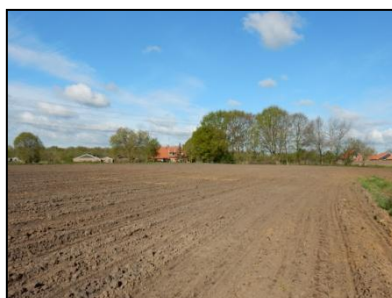
Figuur 7. Bouwland op oostelijke deel van de onderzoekslocatie.