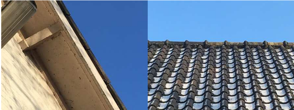
Links: goed sluitende gevelpannen. Rechts; nokpannen in cement. Deze nauwe afdichting biedt vleermuizen geen kans een verblijfplaats te bezetten onder het dakvlak.

Omdat het gebouw wit geverfd is, zouden eventuele uitwerpselen op de buitenmuur duidelijk opvallen. Door de uitvoering van de voorgenomen activiteiten worden geen vleermuizen verwond of gedood en worden geen verblijfplaatsen beschadigd of vernield.