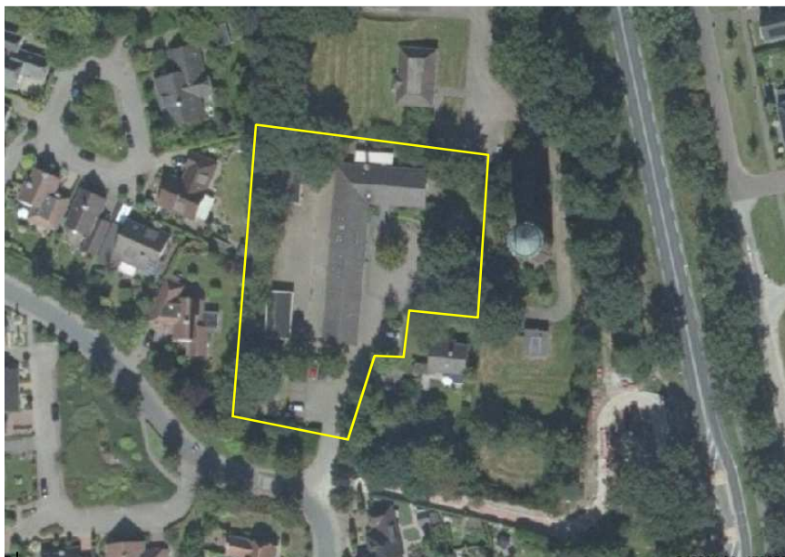
Detailweergave van het plangebied. De begrenzing wordt met de gele lijn aangeduid.

Het plangebied vormt een bestaand erf waar tot voor kort een praktijk voor fysiotherapie gevestigd was. In het plangebied staan een wit geschilderd bakstenen gebouw, welke gedekt is met gebakken dakpannen en twee kapschuren. Deze hebben een bakstenen borstwering, plat dak en zijn met houten planken afgetimmerd. Het bakstenen gebouw beschikt vermoedelijk over een (holle) spouw, de kapschuren niet. Het bakstenen gebouw is kwalitatief hoogwaardig gebouwd en afgewerkt en verkeert in een goede staat van onderhoud. De nokpannen zijn allemaal in cement gelegd en de gevelpannen sluiten nauw aan op de windveer. Het plangebied wordt omgeven door hoge opgaande bomen, zoals berken, eiken en acacia's. Op het erf staan enkele beukenscheerhagen en laurierhagen. Op onderstaande luchtfoto wordt het plangebied in detail weergegeven, evenals de begrenzing.