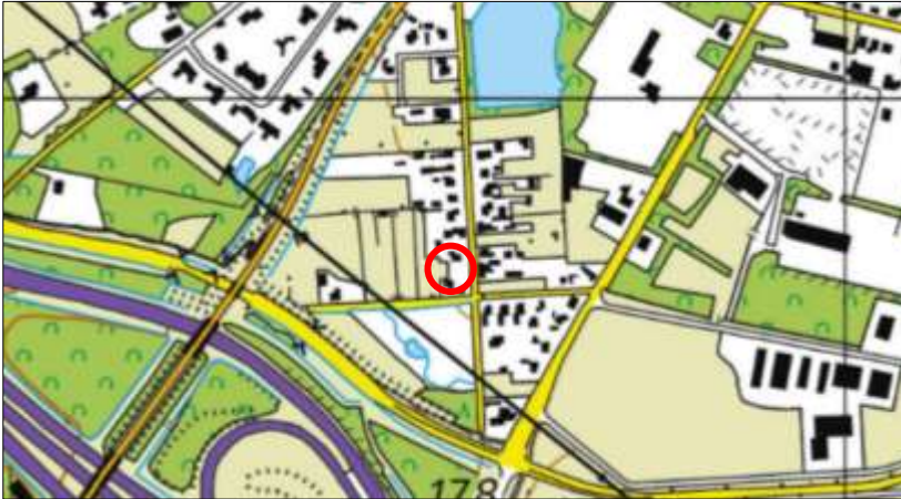
Globale ligging van het plangebied. De ligging van het plangebied wordt met de rode cirkel aangeduid.

Het plangebied is gesitueerd aan de Veldovenweg (ongenummerd) tussen nummer 26 en 28 te Borne. Het ligt in het zuidelijke deel van de woonkern Borne en wordt omgeven door landelijk- en stedelijk gebied. Onderstaande afbeelding wordt de globale ligging van het plangebied weergegeven op een topografische kaart.