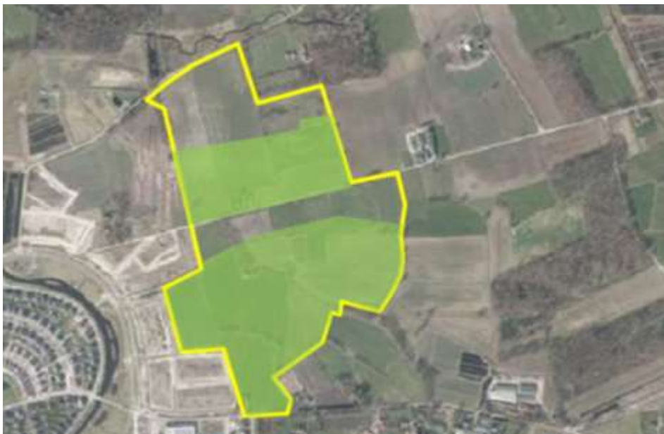
Detailopname en begrenzing van het plangebied. De groene vlakken binnen de begrenzing zijn recentelijk onderzocht. Het overige deel van het plangebied, behoort tot het plangebied van deze studie. (bron luchtfoto: pdok).

Het plangebied bestaat volledig uit agrarische gronden. Deze worden intensief beheerd als akker- of als grasland. Op onderstaande luchtfoto wordt het plangebied in detail weergegeven, evenals de begrenzing.