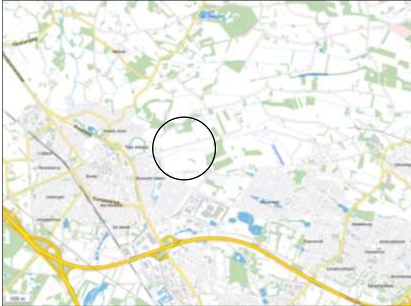
Globale ligging van het plangebied op de topografische kaart (bron kaart: PDOK).

Het plangebied ligt ten oosten van de kern Borne en omvat agrarische gronden ten noorden en ten zuiden van de Hemmelhorst. Op onderstaande afbeelding wordt de globale ligging van het plangebied weergegeven op een topografische kaart.