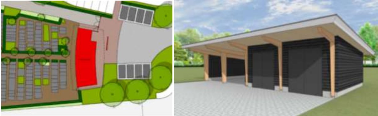
Links: voetprint van het nieuwe beheerderskantoor. Rechts: verbeelding van de nieuwe machineberging.

Het concrete voornemen bestaat om het beheerdersgebouw, de prefab-garagebox en de machineberging te slopen en een nieuw beheerdersgebouw en machineberging op te richten. Om het nieuwe beheerderskantoor en de nieuwe machineberging te bouwen hoeven er geen bomen of struiken gerooid te worden. Als gevolg van de sloop- en bouwwerkzaamheden sneuvelt mogelijk een kleine scheerhaag welke nu tegen het beheerderskantoor groeit. Op onderstaande afbeelding wordt het wenselijke eindbeeld weergegeven.