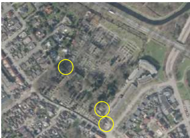
Detailopname van het plangebied. De ligging van de drie deelgebieden wordt met de cirkels aangeduid.

Het plangebied vormt een deel van de gemeentelijke begraafplaats en bestaat uit drie deelgebieden. Het betreft het beheerdersgebouw, een prefab-garagebox en werktuigenberging/opslag. De drie deelgebieden bestaan uit bebouwing en erfverharding. Het beheerderskantoor is gebouwd van bakstenen en heeft een met bitumen dakleer gedekt plat dak. Het gebouw beschikt over een (geïsoleerde) spouw. De garagebox heeft betonnen wanden en een houten aanbouw zonder wandisolatie. De werktuigenberging vormt een kapschuur met wanden en dakbedekking van damwand. In de kapschuur lagen ook bouwmaterialen opgeslagen. Op onderstaande luchtfoto wordt de ligging van het plangebied op een luchtfoto weergegeven. Voor een verbeelding van het plangebied wordt verwezen naar de fotobijlage.