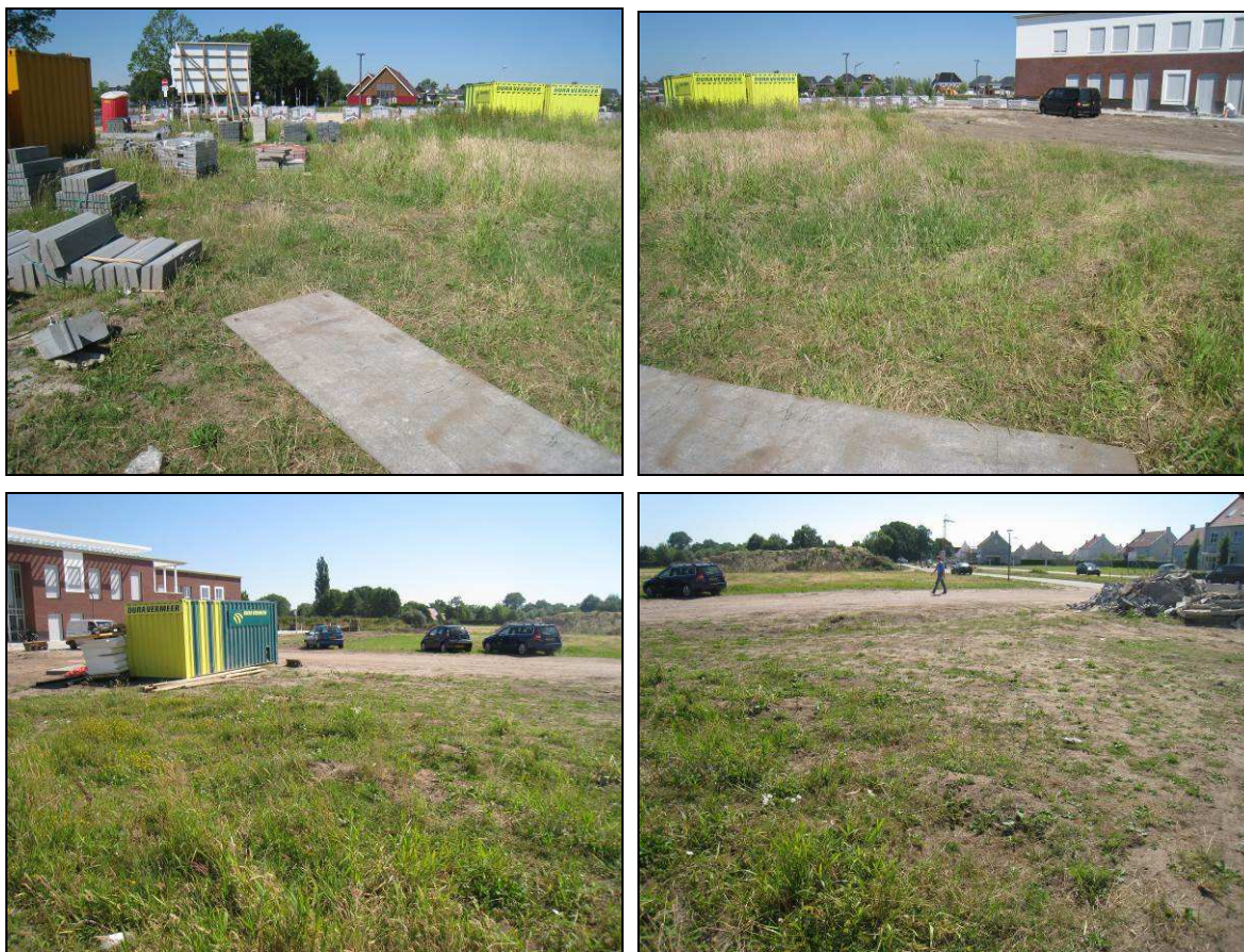
Figuur 2. Aanzicht van het zuidwestelijk deelgebied van De Veste te Borne.