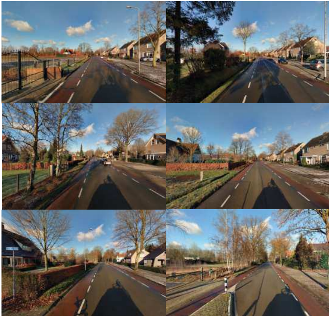
Figuur 2 Kenschets langs de Twickelerblokweg in beelden (Globespotter 2015/2016)