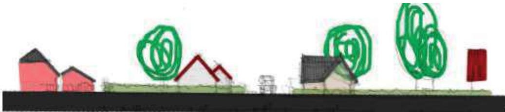
Figuur 4 indicatie van het aangezicht van twee vrijstaande woningen met behoud van openheid

Uitwerking voor beide percelen: Langs of haakse kap (eventueel samengesteld) is afwisselend op de kavels mogelijk. De verkavelrichting is daarbij richtingbepalend; niet de as van de weg. Identieke woningen zijn ongewenst.