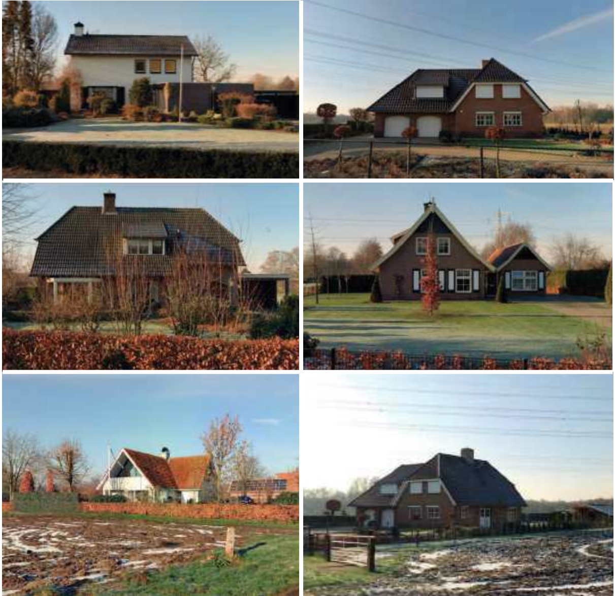
Figuur 5 Aansluiten bij het bestaande architectuurbeeld: traditioneel, baksteen en in verschillende kleuren