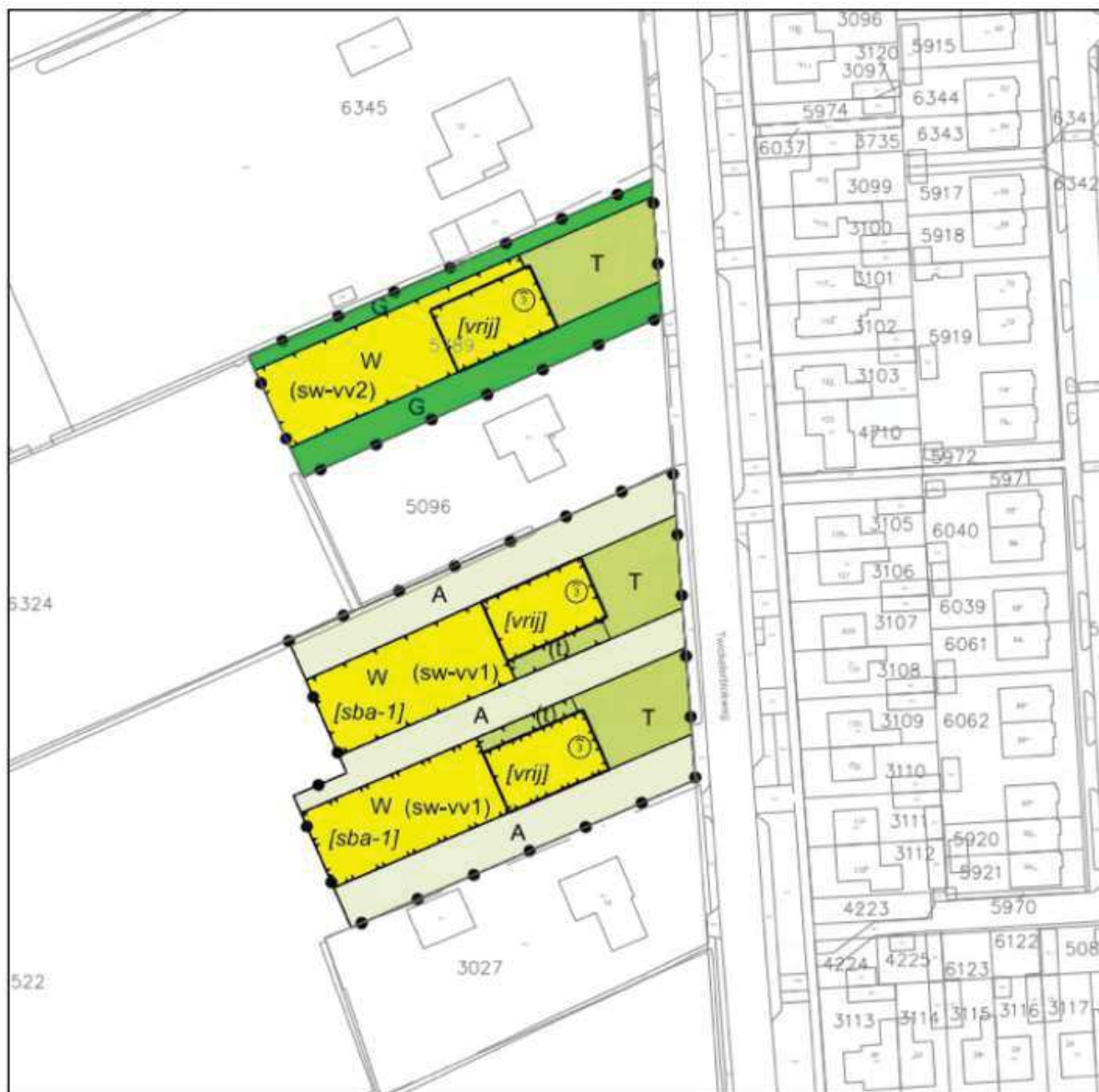
Figuur 3 Planologische invulling ontwikkeling Twickelerblokweg

De uitgangspunten uit de notitie van 2012 zijn hieronder voor de beoogde ontwikkeling nader uitgewerkt.