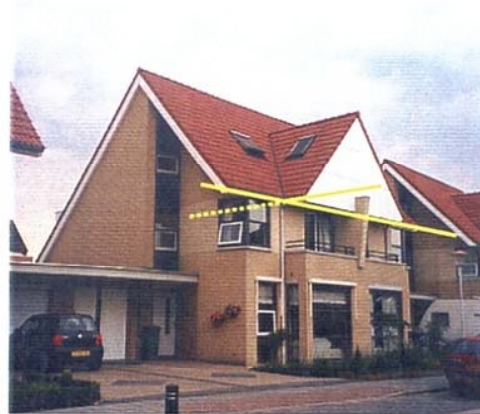
Kniklijn op voor-, achter- en zijgevels