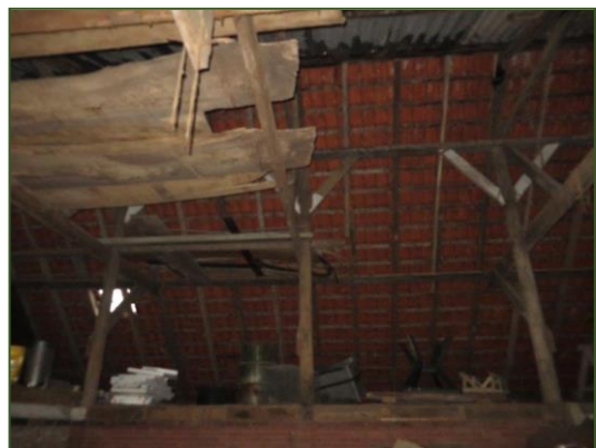
Foto's: Toegang tussen golfplaten en beschot goed afgesloten en ontbreken van beschot bij pannendak.

Er zijn geen sporen, zoals braakballen, veren en urinesporen, aangetroffen van uilen, zoals van de steen- en kerkuil. Er zijn tevens geen exemplaren van deze soorten waargenomen. Jaarrond beschermde nesten/ horsten van roofvogels zijn niet te verwachten binnen het plangebied.