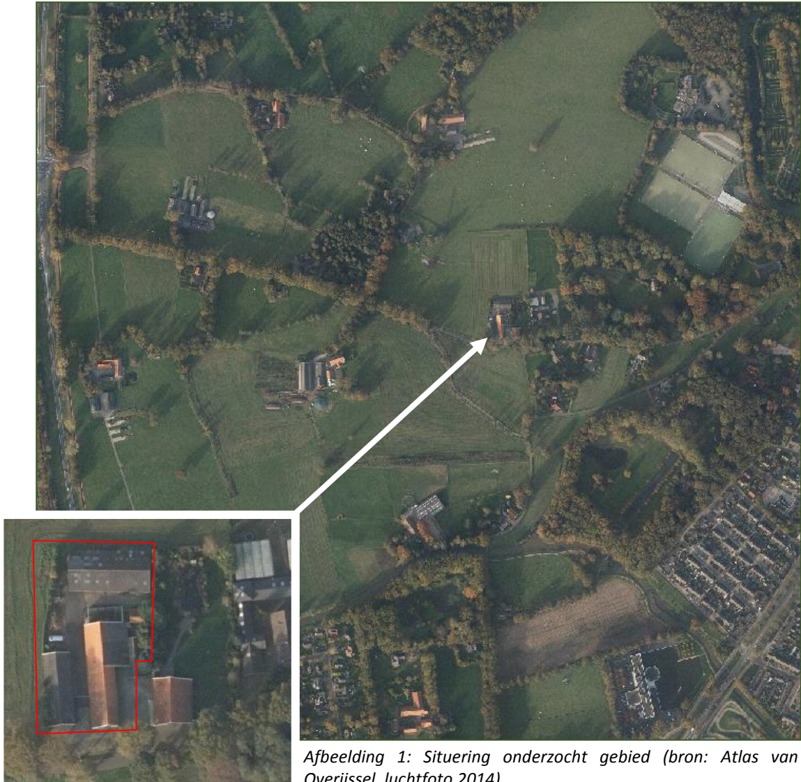
Afbeelding 1: Situering onderzocht gebied (bron: Atlas van Overijssel, luchtfoto 2014).

Het plangebied ligt ten westen van de kern van Almelo en betreft een voormalig agrarisch perceel. De te amoveren opstallen bestaan uit stallen en schuren. De woonboerderij en de groene garage zijn geen onderdeel van het onderzoek.