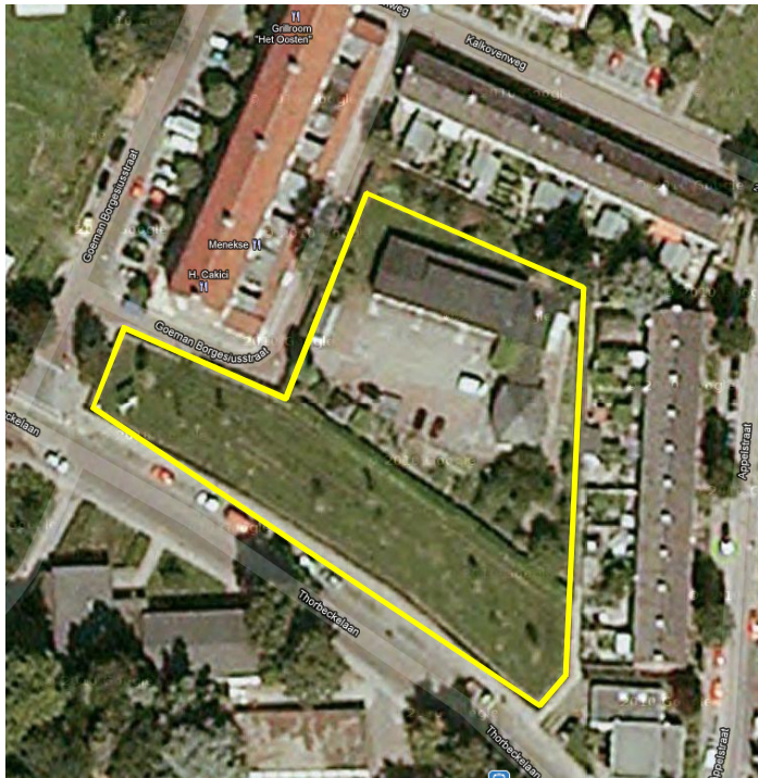
Detailopname van het plangebied. Het plangebied wordt met de gele lijn aangeduid.