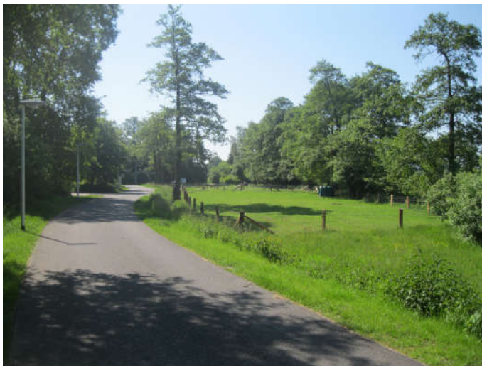
Figuur 3.1: Overzichtsfoto optimale leefgebied Steenuil langs de Mooie vrouwenweg

Als gevolg van de plannen verdwijnen geen nestlocaties, de bestaande erven en nestlocaties blijven namelijk behouden. Gezien de grote afstand van de bouwwerkzaamheden ten opzichte van de nestlocaties kunnen negatieve effecten als gevolg van verstoring ook worden uitgesloten. Wel kan verlies van foerageergebied leiden tot aantasting van de functionaliteit van de nestplaats. Voor alle (mogelijke) nestlocaties/territoria geldt echter dat het belangrijkste foerageergebied (erven) behouden blijft. Een goed voorbeeld betreft de nestlocatie aan Kesseliersweg 2. Afgelopen 1,5 jaar zijn namelijk rond het erf diverse werkzaamheden uitgevoerd zoals aanleg infrastructuur, bouwrijp maken terreinen en realisatie nieuwbouw. Het territorium is in 2019 nog steeds in gebruik en er zijn vier jongen grootgebracht. Hierbij dient wel opgemerkt te worden dat de gemeente bewust heeft ingezet op het aanbieden en dus realiseren van leefgebied in de nabijheid van de nestlocatie binnen het gemeentelijk groen.