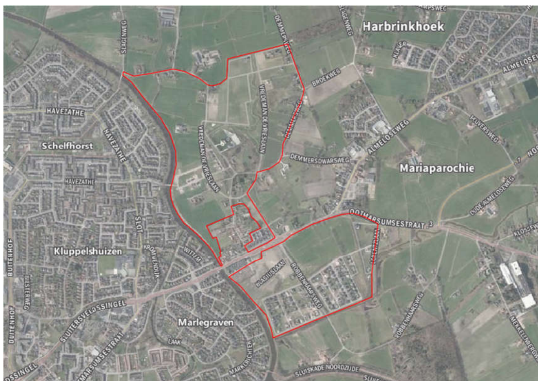
Figuur 1.1 Plangebied (rood omkaderd) Almelo NoordOost.

Het plangebied Almelo NoordOost is gelegen ten noordoosten van de kern Almelo (zie figuur 1.1). Het betreft een half open landschap bestaande uit weilanden, agrarische percelen en bebouwing. Binnen het plangebied zijn sloten en bomenrijen aanwezig.