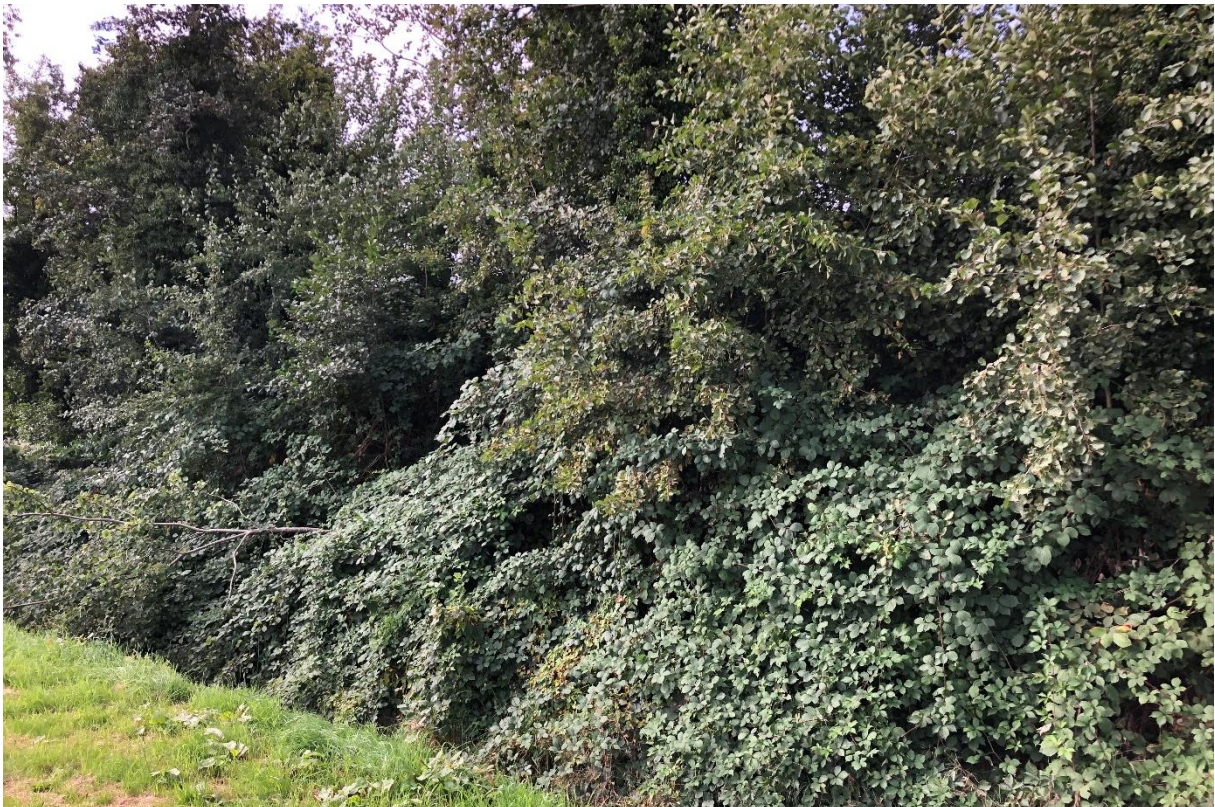
Afbeelding 3. Impressie plangebied, situatie op 20 september 2021.