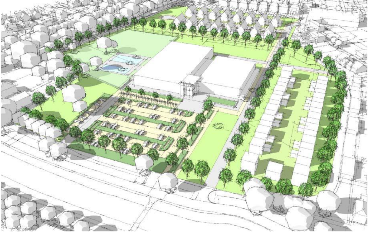
Afbeelding 2. De uiteindelijke situatie.