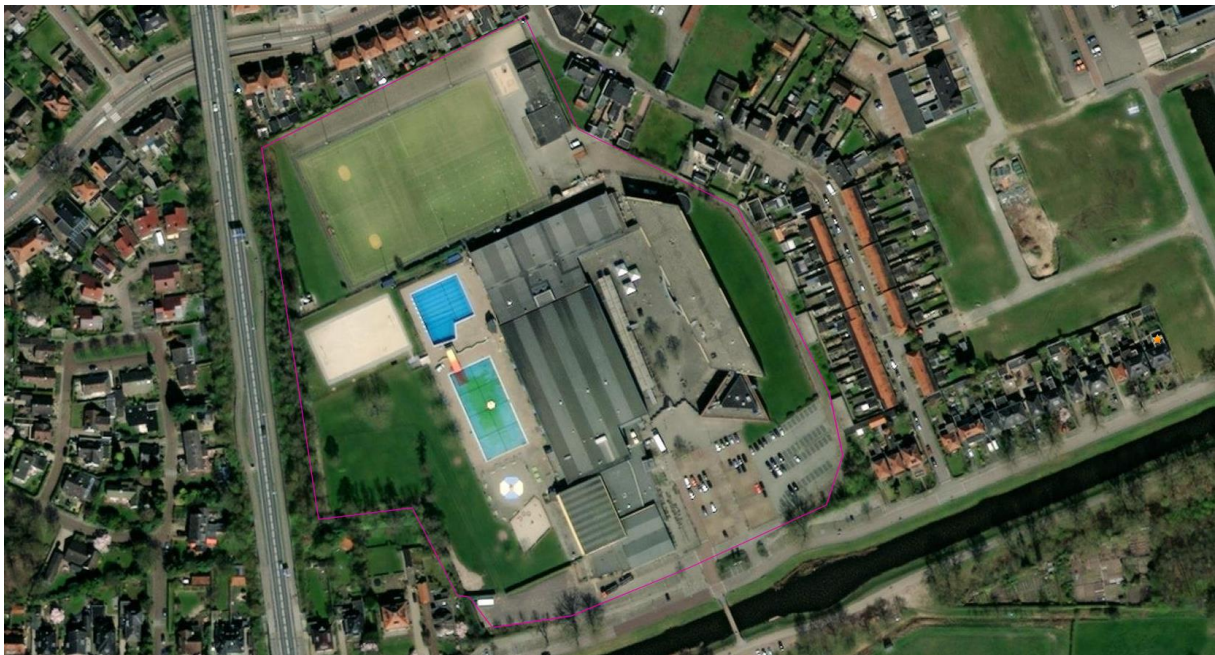
Afbeelding 1. Begrenzing van het plangebied (paars).

De gemeente Almelo is voornemens het gehele sportpark opnieuw in te richten. In eerste instantie wordt de sporthal gesloopt en een deel van het Erasmus. Daarna wordt ook de rest van het Erasmus gesloopt (planning 2023). Het zwembad blijft staan totdat het nieuwe zwembad gereed is en zal daarna worden gesloopt. In afbeelding 2 wordt het eindbeeld getoond. In afbeelding 3 worden enkele foto's van de huidige situatie getoond. Deze foto's zijn gemaakt ten tijde van het veldbezoek op maandag 20 september 2021.