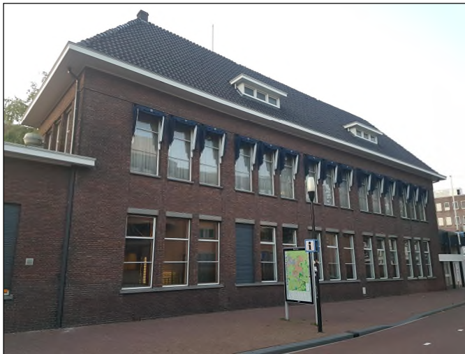
Afbeelding 9: zuidoostzijde Egbert Gorterstraat Almelo

Om een indicatie te krijgen van de aanwezigheid van beschermde soorten in en rond het plangebied is de Nationale Databank Flora en Fauna (NDFF) geraadpleegd. Er zijn in de NDFF geen waarnemingen van beschermde soorten aanwezig uit het plangebied. In de ruimere omgeving komen wel diverse beschermde soorten vogels en zoogdieren, waaronder gierzwaluw, huismus en gewone dwergvleermuis.