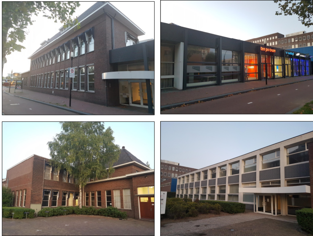
Afbeelding 3 t/m 6: Indruk bebouwing plangebied.