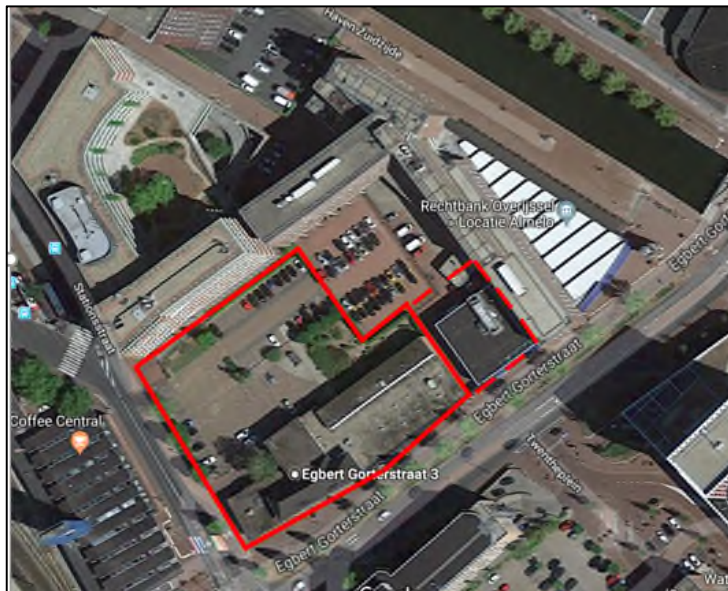
Afbeelding 1: Ligging plangebied in Almelo.

Voor enkele gebouwen aan de Egbert Gorterstraat in Almelo bestaan herontwikkelingsplannen, waarbij de huidige bebouwing (mogelijk) wordt gesloopt en wordt vervangen door nieuwbouw. In opdracht van het ministerie van Binnenlandse Zaken en Koninkrijkrelaties is hiervoor een verkennend natuuronderzoek uitgevoerd om de mogelijke effecten van de voorgenomen werkzaamheden op beschermde natuurwaarden in beeld te brengen. Voorliggend rapport bevat de uitkomsten van het verkennend natuuronderzoek.