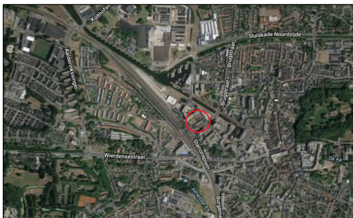
Afbeelding 2: Ligging plangebied in Almelo.