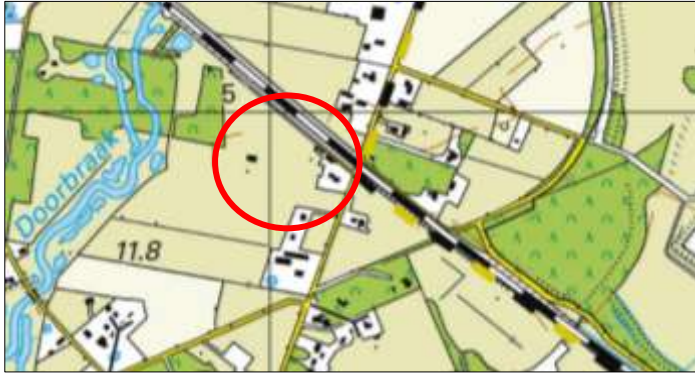
Globale ligging van het plangebied. De ligging van het plangebied wordt met de rode cirkel aangeduid.

Het plangebied is gesitueerd aan de Grote Bavenkelsweg 11 te Bornerbroek, gemeente Almelo. Het ligt circa 3 kilometer ten noordoosten van de woonkern Bornerbroek en wordt omgeven door landelijk gebied. Op onderstaande afbeelding wordt de globale ligging van het plangebied weergegeven op een topografische kaart.