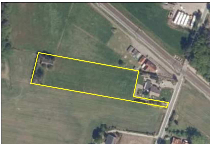
Begrenzing van het plangebied; deze wordt met de gele lijnen aangeduid.

Het plangebied vormt een deel van een bestaand woonerf en bestaat verder uit een perceel agrarisch cultuurland en een voormalig erf met een oude boerderij en opgaande beplanting rondom de oude boerderij. De oude boerderij beschikt over bakstenen buitengevels en heeft een met dakpannen gedekt zadeldak. Aan de oorspronkelijke boerderij is aan de zuidzijde een aanbouw gerealiseerd. Deze aanbouw heeft een plat dak. Het gebouw wordt al enige decennia niet meer bewoond en de staat van onderhoud van het gebouw is slecht; er zitten grote gaten in het dak en de gevels waardoor het gebouw niet wind- en waterdicht is. Rondom de boerderij staan fijnsparren en loofbomen. Een flink deel van de fijnsparren is dood. Rondom het gebouw liggen opgeslagen (bouw)materialen en rommel. Het centrale- en het oostelijke deel van het plangebied bestaat volledig uit grasland. Dit grasland wordt intensief beheerd (bemesten, maaien en afvoeren maaisel) en bestaat uit een soortenarme vegetatie van raagras. Op onderstaande luchtfoto is de begrenzing van het plangebied aangegeven. Voor een impressie van het plangebied wordt verwezen naar de fotobijlage.