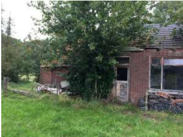
Amfibieën kunnen een (winter)rustplaats bezetten onder opgeslagen spullen en rommel in de buitenruimte.

Tijdens het veldbezoek zijn geen amfibieën waargenomen, maar gelet op de inrichting en het gevoerde beheer, wordt het plangebied als functioneel leefgebied voor sommige algemene en weinig kritische amfibieënsoorten beschouwd. Amfibieën als bruine kikker en gewone pad benutten het plangebied als foerageergebied en mogelijk bezetten ze er een (winter)rustplaats. Deze soorten kunnen een (winter)rustplaats bezetten in holen en gaten in de grond, onder strooisel en bladeren en onder opgeslagen spullen/rommel in de binnen- en buitenruimte. De boerderij is voor amfibieën toegankelijk om te betreden. Het intensief beheerd agrarisch cultuurland vormt geen geschikt leefgebied voor amfibieën. Het plangebied wordt niet als functioneel leefgebied van zeldzame amfibieënsoorten als kamsalamander, rugstreppad of poelkikker beschouwd. Geschikt voortplantingsbiotoop ontbreekt in het plangebied.