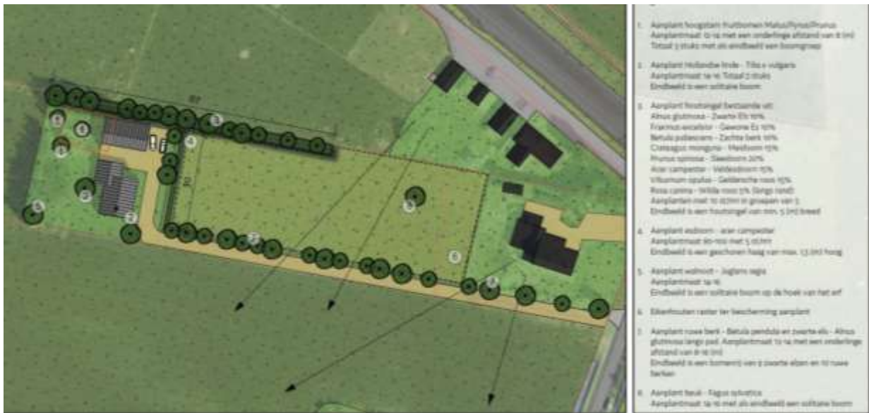
Verbeelding van het wenselijk eindbeeld.

Er zijn plannen om een oude, vervallen boerderij slopen en een nieuwe woning met bijgebouw te realiseren. De woning en het bijgebouw worden ontsloten op de Grote Bavinkelsweg via een nieuw aan te leggen (verharde) inrit. Een groot deel van de aanwezige opgaande beplanting wordt verwijderd. Het nieuwe erf wordt nadien landschappelijk ingepast door middel van de aanplant van erfbeplanting (o. a. ruwe berk, zwarte els, beukhaag, solitaire beuk en hoogstam fruitbomen). Op onderstaande afbeelding wordt een plattegrond van het wenselijk eindbeeld weergegeven.