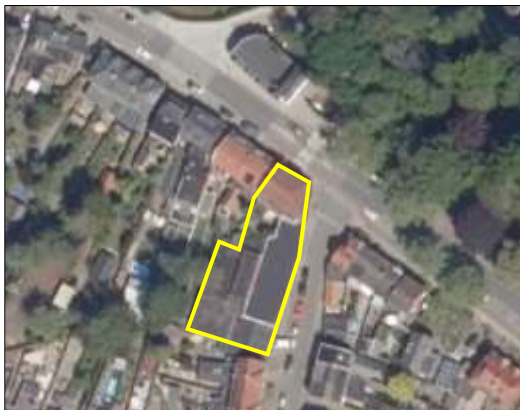
Begrenzing van het plangebied; deze wordt met de gele lijnen aangeduid (bron luchtfoto: ruimtelijkeplannen.nl).

Het plangebied bestaat volledig uit bebouwing welke beschikt over bakstenen buitengevels met luchstpouw. Het hoofdgebouw aan de Bornsestraat beschikt over een met dakpannen gedekt zadeldak, de aanbouw aan de achterzijde heeft een plat dak en is gedekt met biumen dakleer. Aan de achterzijde van het hoofdgebouw ligt een kleine binnentuin met verharding. Het plangebied grenst met de noord- en oostzijde aan verharde weg en met de zuid- en westzijde aan bebouwing en erfverharding. Op onderstaande luchtfoto is de begrenzing van het plangebied aangegeven. Voor een impressie van het plangebied wordt verwezen naar de fotobijlage.