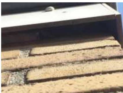
De ruimte tussen de boeiboord en de buitengevel is te groot voor vleermuizen om een verblijfplaats achter te bezetten.

Er zijn tijdens het veldbezoek geen vleermuizen waargenomen en er zijn geen aanwijzingen gevonden dat vleermuizen een rust- of voortplantingsplaats in het plangebied bezetten. De bebouwing beschikt weliswaar over gemetselde buitengevels met luchtspouw, maar er zijn geen invliegopeningen zoals open stootvoegen of ventilatieopeningen aangetroffen die vleermuizen de kans bieden een verblijfplaats te bezetten. De aanbouw aan de achterzijde is voorzien van brede boeiboorden, maar de ruimtes tussen de boeiboorden en de buitengevel zijn te groot voor vleermuizen om er een verblijfplaats achter te bezetten. Verder zijn in het plangebied geen potentiële verblijfplaatsen van vleermuizen waargenomen, zoals een holle ruimte achter een windveer, loodslab, vensterluik, zonnewering of gevelbetimmering aangetroffen.