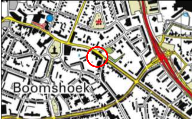
Globale ligging van het plangebied. De ligging van het plangebied wordt met de rode cirkel aangeduid.

Het plangebied is gesitueerd aan de Bornsestraat 161 te Almelo. Het ligt centraal gelegen in de woonkern Almelo en wordt omgeven door stedelijk gebied. Onderstaande afbeelding wordt de globale ligging van het plangebied weergegeven op een topografische kaart.